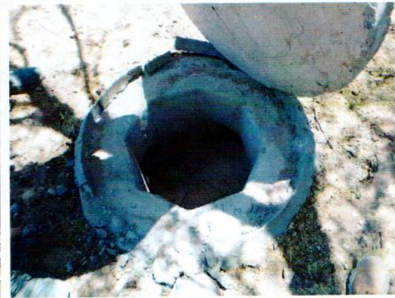
Interior de pozo de visita

OPERADO CON RECURSOS DEL CINCO AL MILLAR EJERCICIO FISCAL 2019