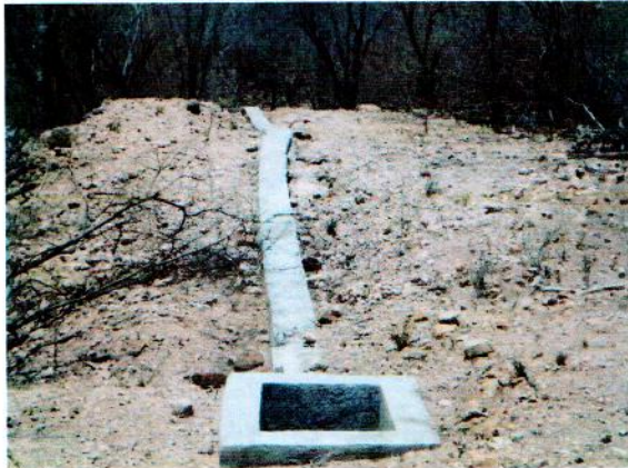
Encofrado y registro de conduccion de pozo a tanque