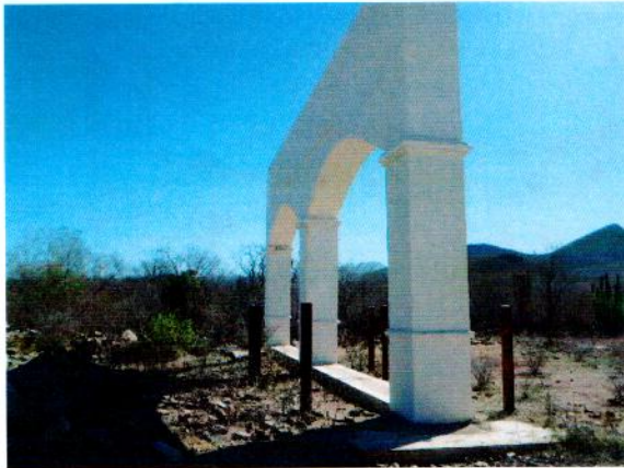
Acceso monumental a localidad