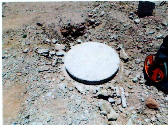
Pozo de visita con tapa de concreto