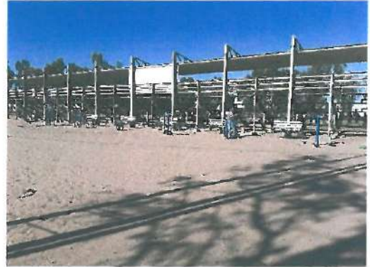
Vista de aparatos ejercitadores y bancas