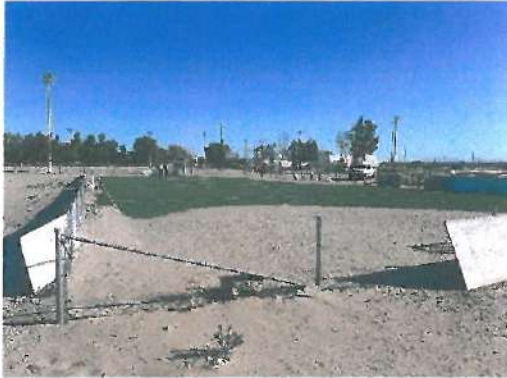
Vista de Cancha de Futbol Rápido con pasto sintético