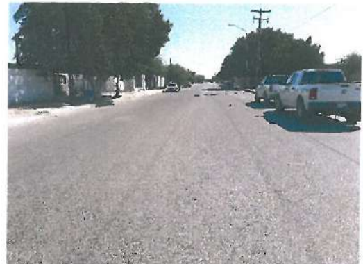
Vista de la Calle Mérida A

El día 23 de octubre de 2019, se tuvo problemas con el encendido de vehículo asignado para revisión, siendo el problema la batería, la cual tuvo que adquirir, seguidamente nos reunimos con residente de la SIDUR, continuando con la revisión física de la calle obra: Pavimentación con concreto asfáltico en Ave. Quintana Roo entre Segunda y Séptima en la localidad y municipio de San Luis Rio Colorado: