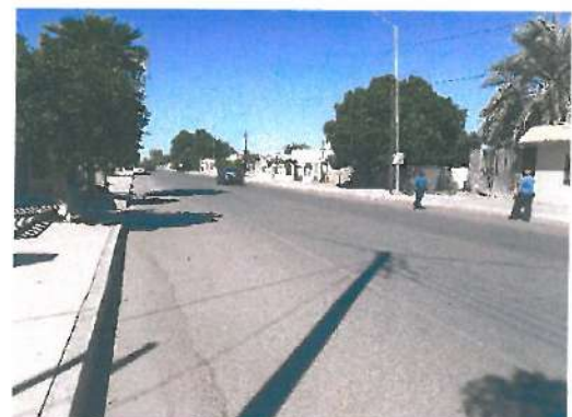
Vista de la Ave. Quintana Roo