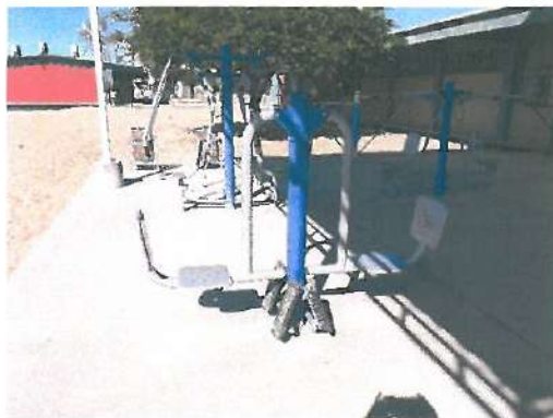
Vista de Cancha de Futbol Rápido con pasto sintético, el suministro e instalación de aparatos para hacer ejercicios, botes para basura.

OPERADO CON RECURSOS DEL CINCO AL MILLAR EJERCICIO FISCAL 2019