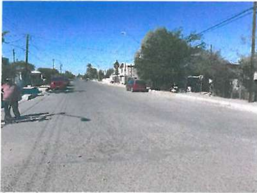
Vista de la Calle Puebla B