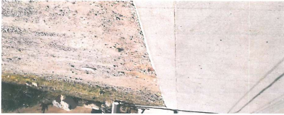
En esta fotografía se muestra el dentellón de concreto

OPERADO CON RECURSOS DEL CINCO ALMILLAR EJERCICIO FISCAL 2019