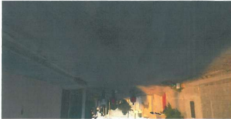
En esta fotografía se muestra la carpeta de mezcla asfáltica