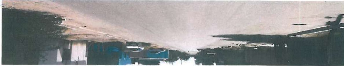
En esta fotografía se muestra la carpeta de mezcla asfáltica

Ubicación de la Calle Quinta Sur entre Avenida Tubutama y Avenida Altar en la Localidad de Caborca, Municipio de Caborca, Sonora