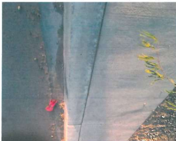
En esta fotografía se muestra la garnición tipo "L"

El día 01 de noviembre de 2019, se continuó con la verificación física a la obra "Pavimentación con concreto hidráulico de la Avenida "A" de la Localidad de Caborca, Municipio de Caborca, Sonora."