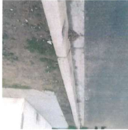
En esta fotografía se muestra la guarnición tipo "L"

Se continuo con la verificación física a la obra "Pavimentación con concreto hidráulico de Avenida "X" entre Primera y Obregón en la Localidad de Caborca, Municipio de Caborca, Sonora."