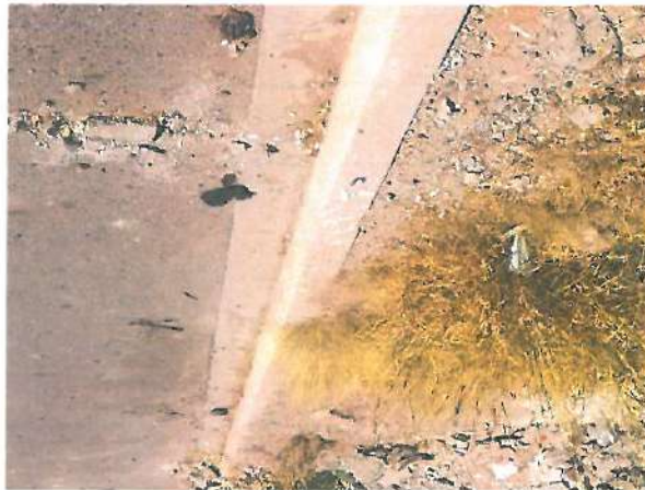
En esta fotografía se muestra la garnición tipo "L"

El día 30 de octubre de 2019, se continuo con la verificación física a la obra "Pavimentación con carpeta asfáltica en Calle Cerro Prieto entre Avenida "L" y "R" en la Localidad de Caborca, Municipio de Caborca, Sonora."