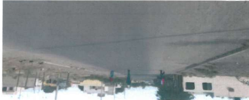
En estas fotografías se muestra la carpeta de mezcla asfáltica