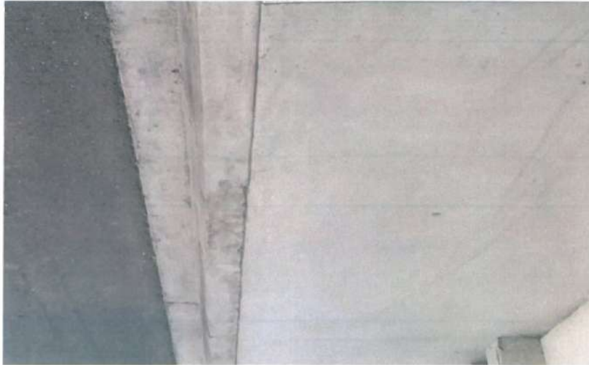
En esta fotografía se muestra la guarnición tipo "L"