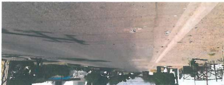
En esta fotografía se muestra la carpeta de mezcla asfáltica