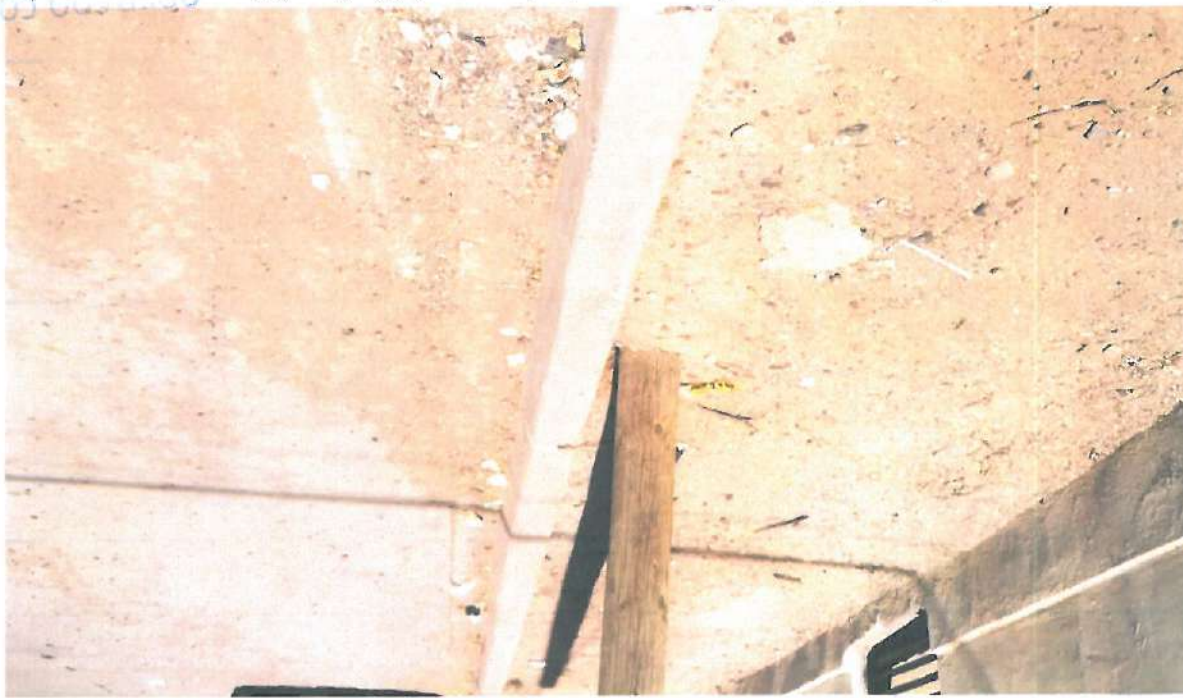
En esta fotografía se muestra la guarnición tipo "L"