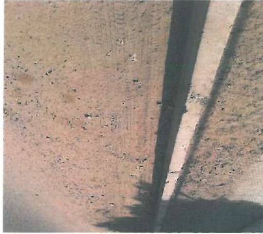
En esta fotografía se muestra la garnición tipo "L"

Se continuo con la verificación física a la obra "Pavimentación con carpeta asfáltica de Avenida Altar entre Calles María de Jesús Méndez y Avenida Séptima Sur en Localidad de Caborca, Municipio de Caborca, Sonora"