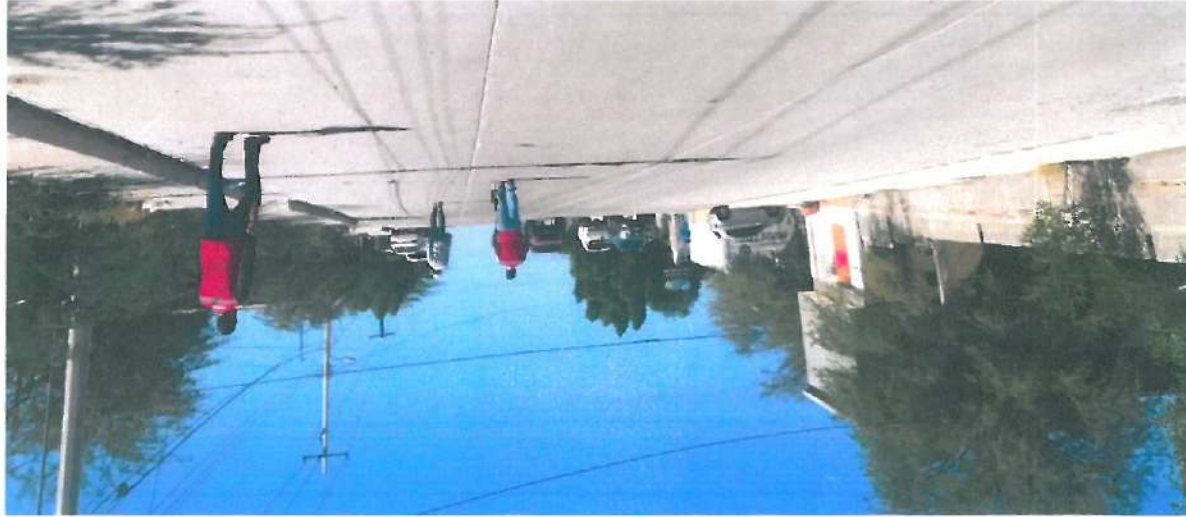
En esta fotografía se muestra pavimento de concreto hidráulico sobre la Calle Séptima.