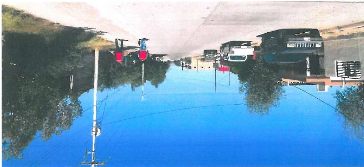
En esta fotografía se muestra pavimento de concreto hidráulico