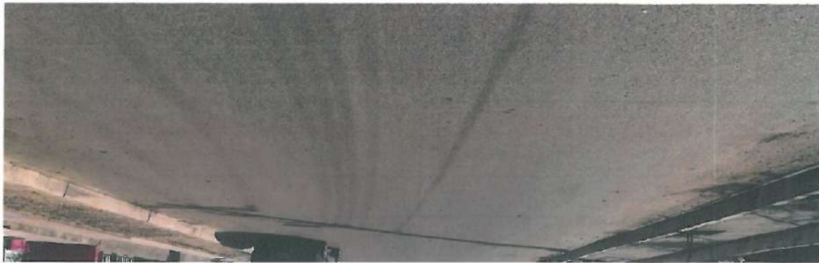
En estas fotografías se muestra la carpeta de mezcla asfáltica