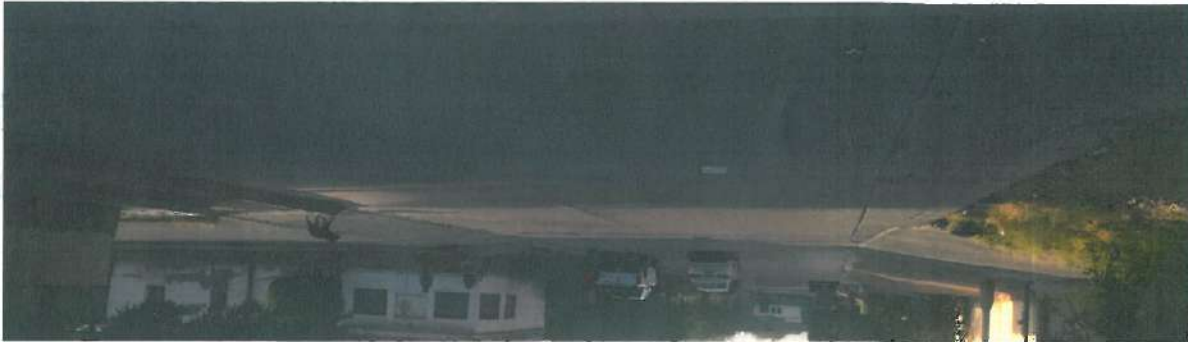
En esta fotografía se muestra pavimento de concreto hidráulico

Ubicación de la Avenida "A" entre Calle 5 y Calle 7 en la Localidad de Caborca, Municipio de Caborca, Sonora."