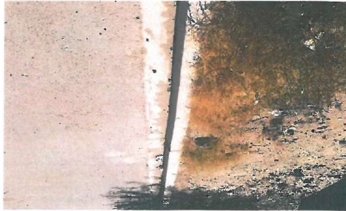
En esta fotografía se muestra la garnición tipo "L"