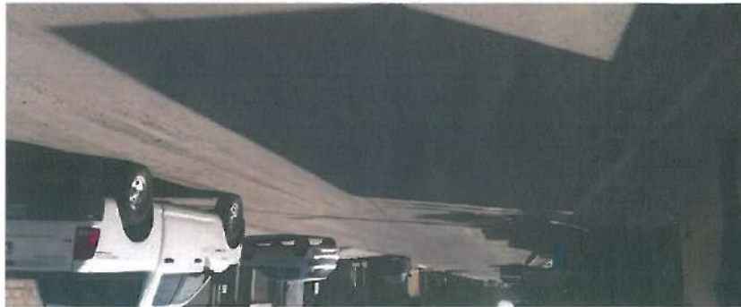
En esta fotografía se muestra la carpeta de mezcla asfáltica