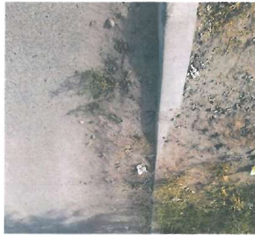
En esta fotografía se muestra la guarnición tipo "L"

Se continuo con la verificación física a la obra "Pavimentación con carpeta asfáltica de Calle Bizani entre Avenidas "J" y "M" en la Localidad de Caborca, Municipio de Caborca, Sonora."