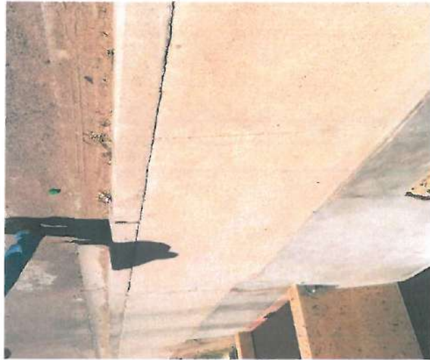
En esta fotografía se muestra la garrnición tipo "L"

Se continuo con la verificación física a la obra "Pavimentación con concreto hidráulico de Calle Quinta Sur entre Primera y Obregón en la Localidad de Caborca, Municipio de Caborca, Sonora."