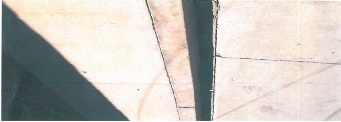
En esta fotografía se muestra la guarnición tipo "L" y banqueta de concreto.