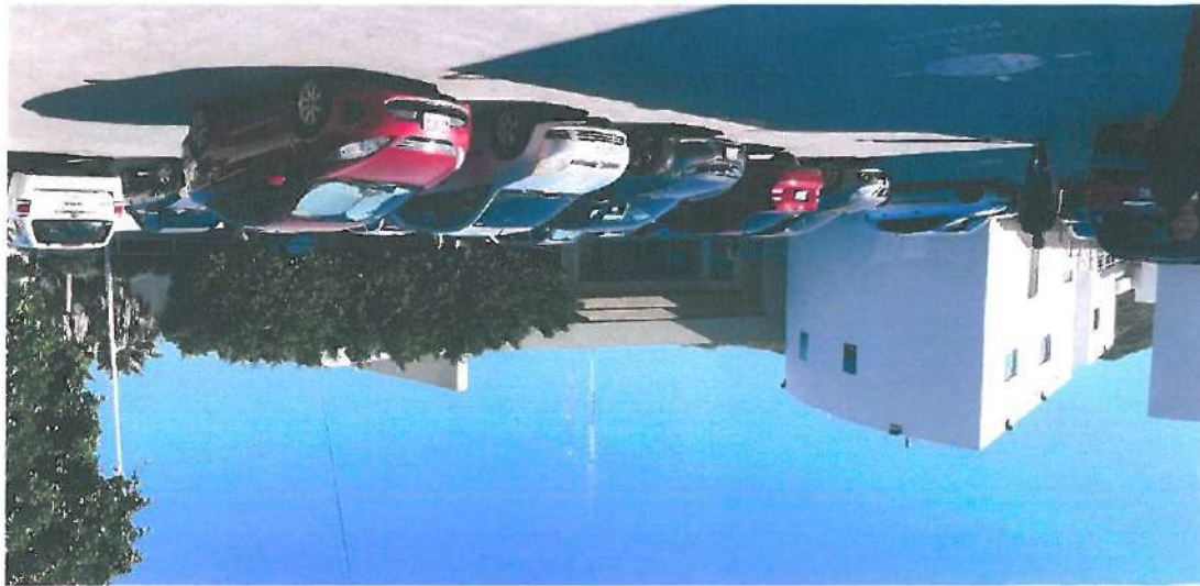
Vista exterior del Hospital General de Guaymas, de la localidad y municipio de Guaymas.

El día 12 de diciembre de 2019, se realizó la revisión de expedientes clínicos en el Hospital General de Guaymas, terminada esta revisión