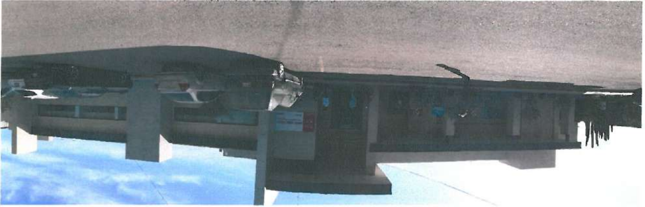
Vista exterior del Hospital de Navojoa

Como conclusión de la verificación física de la adquisición, esta se encuentra en la clínica