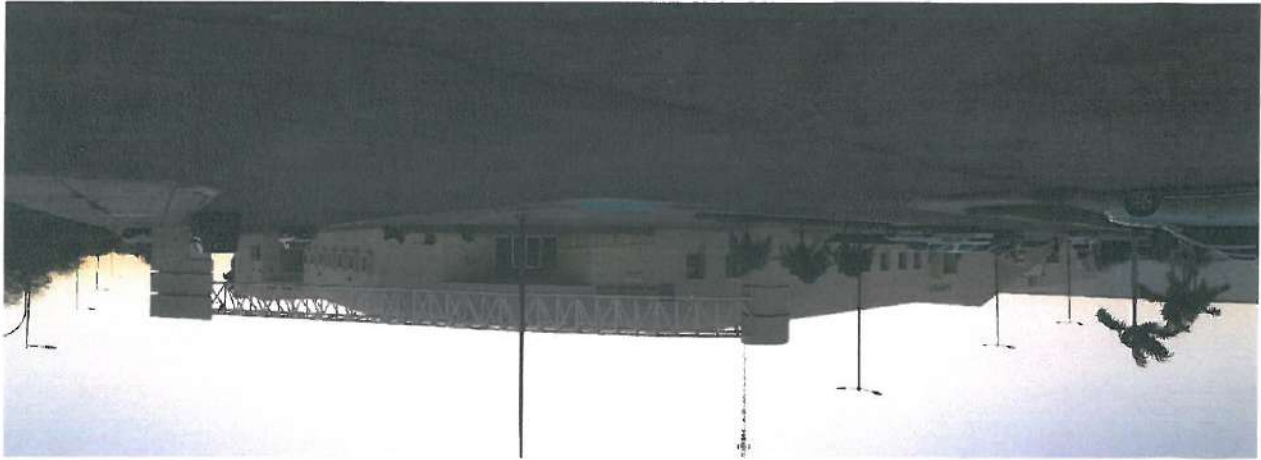
Vista exterior del Hospital de Navjoa