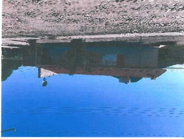
Vista exterior de la Clínica de Salud Rural del Municipio de Alamos

Como conclusión de la verificación de los expedientes clínicos, hubo faltantes de expedientes, así como inconsistencias en ellos