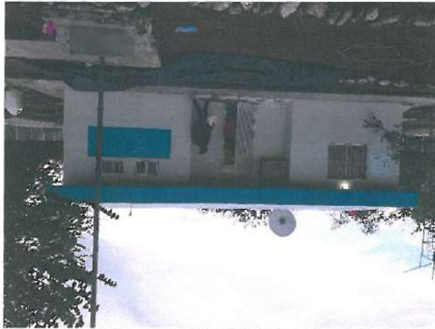
Vista exterior de Centro de Salud Rural de Batacosa

El día 09 de diciembre de 2019, se realizó el traslado a localidad y Municipio de Guaymas, al Hospital General de Guaymas, para revisión de expedientes clínicos del Seguro Popular Siglo XXI, los cuales estaban incompletos, por lo que se pospuso la revisión para el regreso de comisión, seguidamente nos trasladamos a la localidad de Batacosa, Municipio de Quirrego, donde se constató la adquisición de una basculadora mecánica con estadímetro en Centro de Salud Rural Batacosa, terminando nos trasladamos al Hospital de Navojoa, de la localidad y municipio de Navojoa, en el cual se inició con la revisión de expedientes clínicos, no concluyéndose ese día por falta de integración de los expedientes.