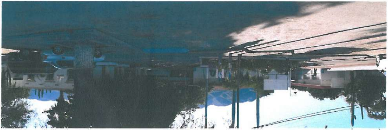
Vista exterior de la Clínica de Salud Rural del Maquipo, Municipio de Alamos