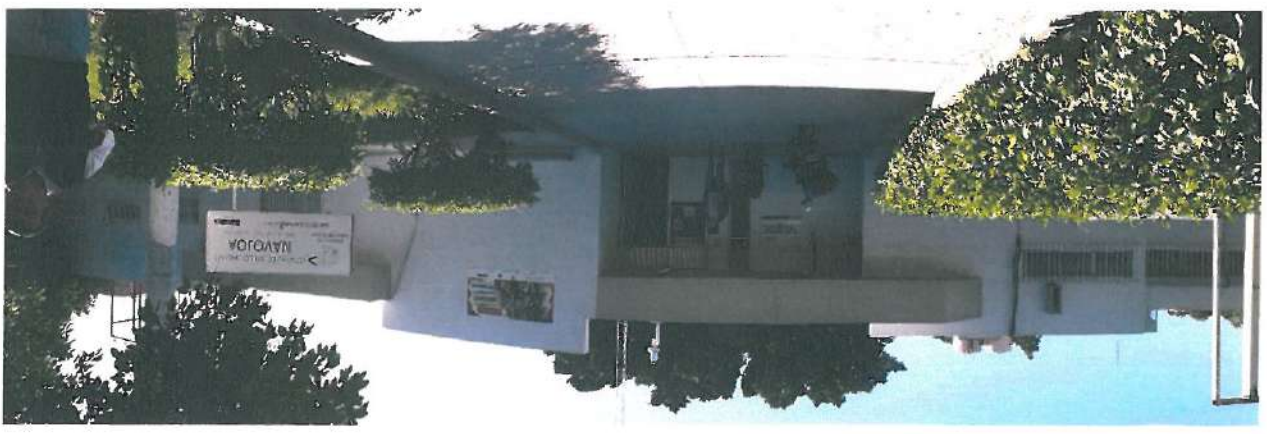
Vista exterior de la Clínica de Salud Urbana de Navojoa