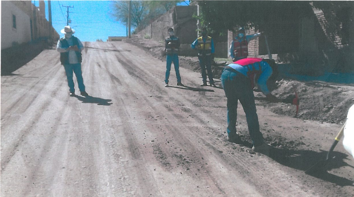
TOMA DE MUESTRA DE SUBRASANTE CON CAL, PARA DETERMINAR SU CALIDAD