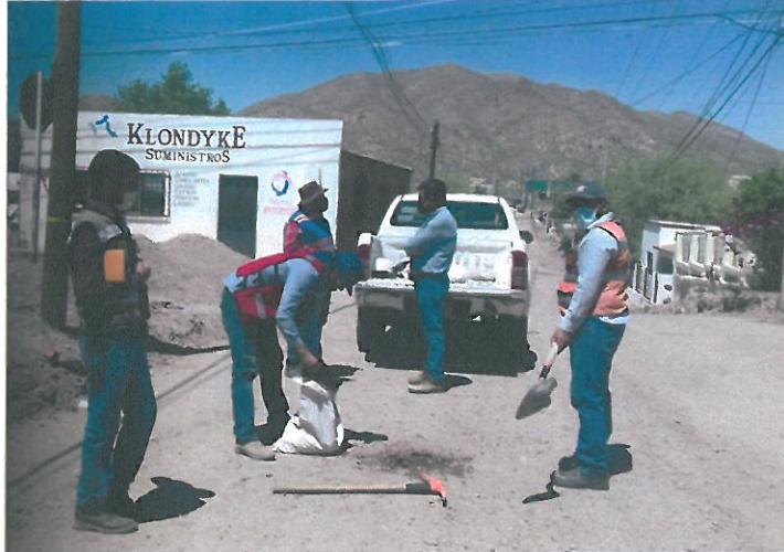
TOMA DE MUESTRA DE BASE HIDRAULICA, PARA DETERMINAR SU CALIDAD