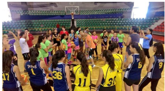
Clínicas de Basquetbol