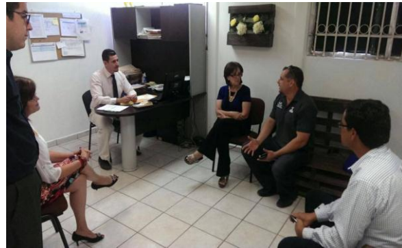
Centros de Desarrollo Municipal (CEDEM)