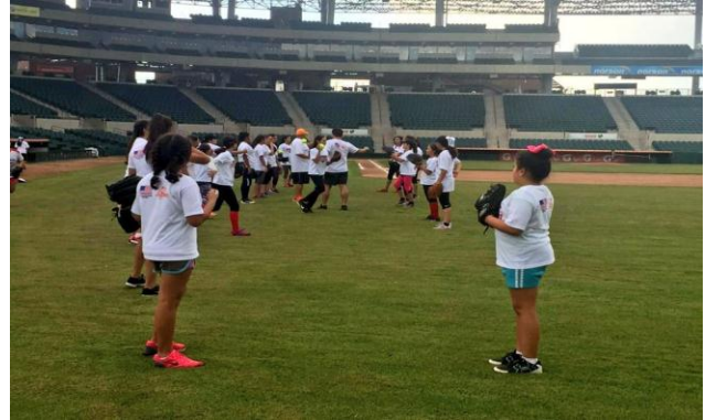
Clínicas de Softbol Entrenadores Universidad TENNESSE