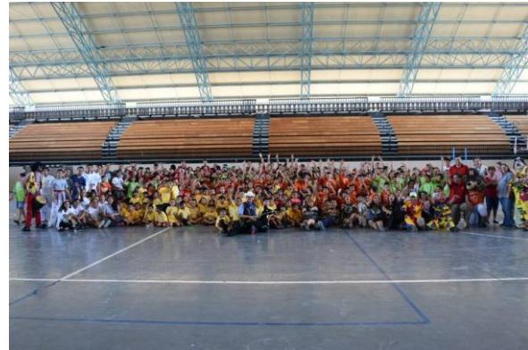
Campamento de Verano