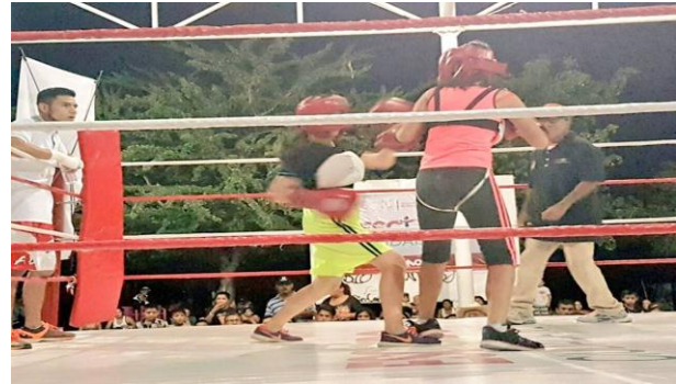
Torneo "Campeón de Campeones"