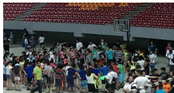
Campamento de Verano Coca- Cola