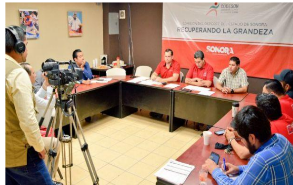
Rueda de Prensa Lanzamiento de Convocatoria Premio Estatal del Deporte 2016