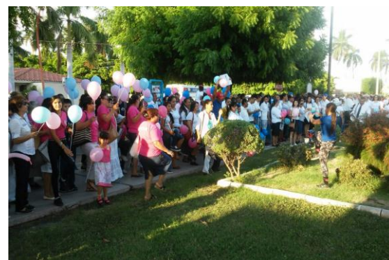
Programa de Activación Física "Tu Zona"