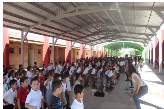
Activación Física "Escolar"