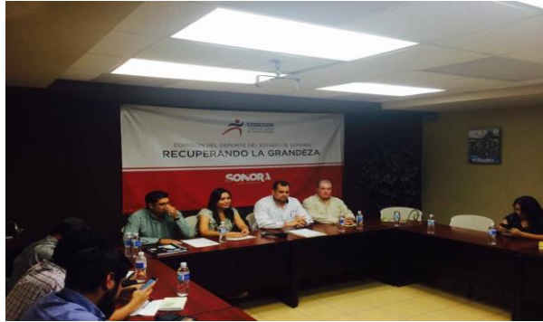
Rueda de Prensa Global Sport Mentoring Program