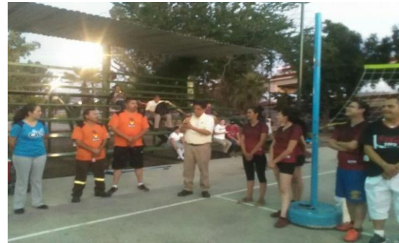
Activación Física Laboral (COCA-COLA)