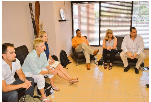
Visita de Global Sport Mentoring Program