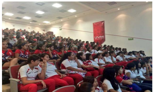
Conferencia "Empoderamiento de la Mujer en el Deporte"