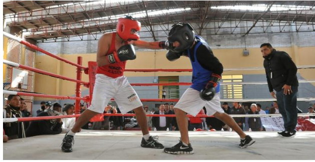
MATERIAL DEPORTIVO DE BOX CERESO