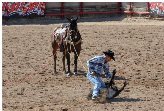
CAMPEONATO NACIONAL DE RODEO