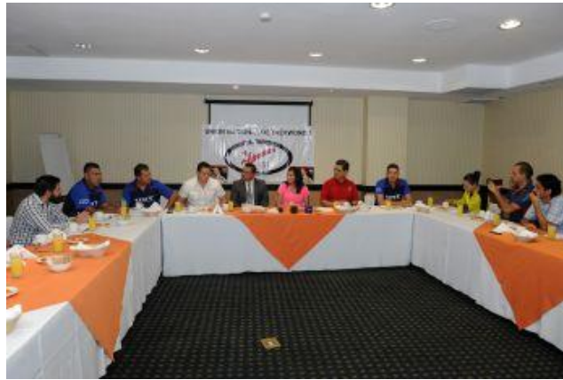
RUEDA DE PRENSA CON LA OLIMPICA MARIA DEL ROSARIO ESPINOZA