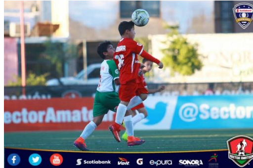
CAMPEONATO NACIONAL FUTBOL SUB-10