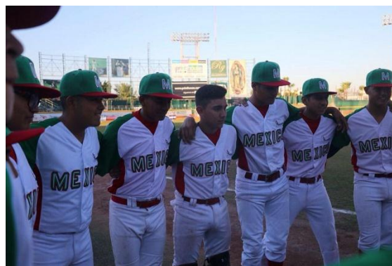
PANAMERICANO DE BEISBOL SUB-14