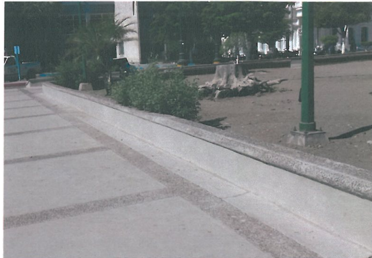
RELIZACION DE ARRIETES Y DETALLADO EN ARRIETES EXISTENTES (ENJARRE Y PINTURA)

OBRA: "CONSTRUCCION DEL CENTRO INTEGRAL DE PROCURACION DE JUSTICIA EN LA LOCALIDAD Y MUNICIPIO DE HUATABAMPO, SONORA"