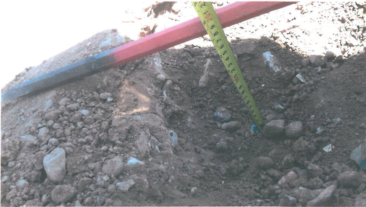
TOMA DE MUESTRA DE CAPA SUBRASANTE, PARA DETERMINAR SU CALIDAD