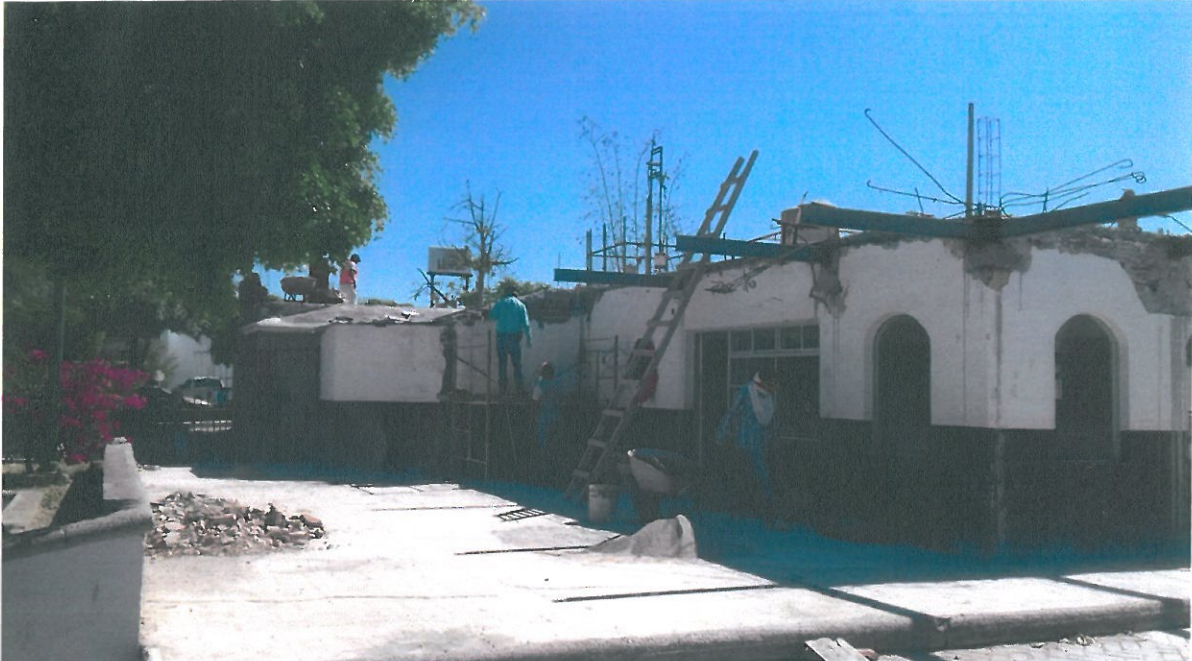
COLOCACION DE LADRILLO PARA DAR NIVEL A LOSA DE AZOTEA Y EN PRETIL, EN LOCALES COMERCIALES.