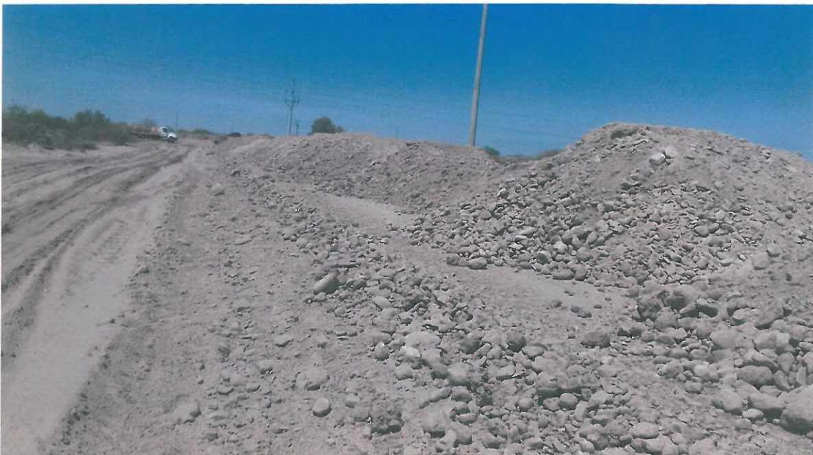
SE APRECIA SUMINISTRO DE MATERIAL DE SUBRASANTE CON SOBRETAMAÑO

Avance que presenta los trabajos al momento de la visita