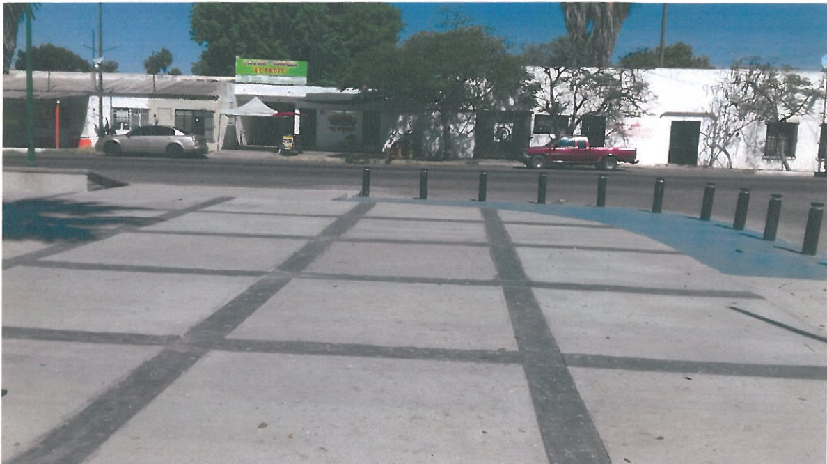
PISO DE CONCRETO EN ESQUINA NORORIENTE DE PLAZA