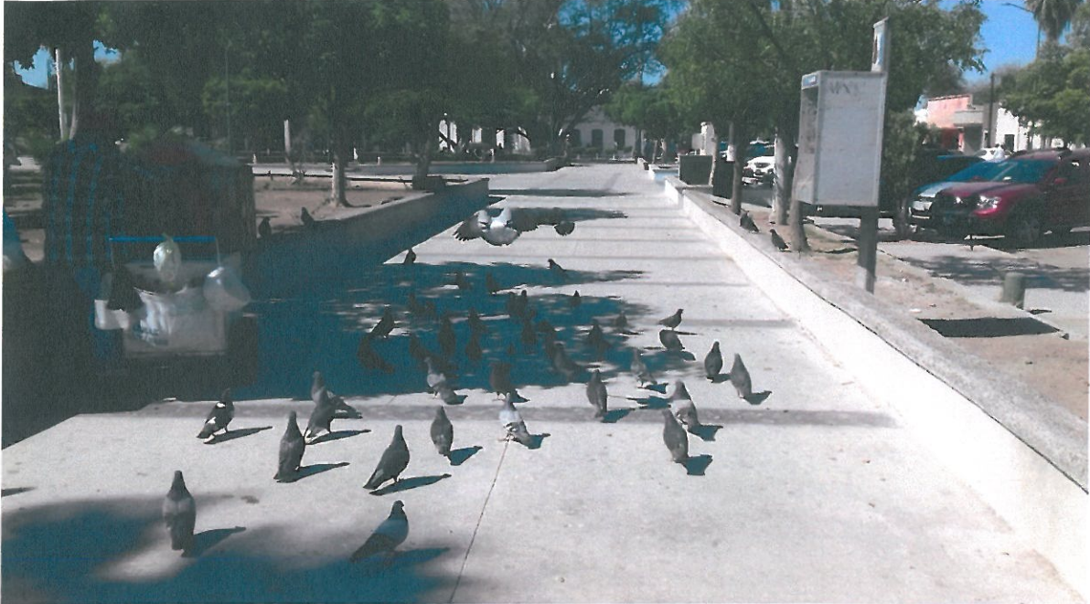
PISO DE 10 CM DE ESPESOR, EN LADO PONIENTE DE PLAZA.