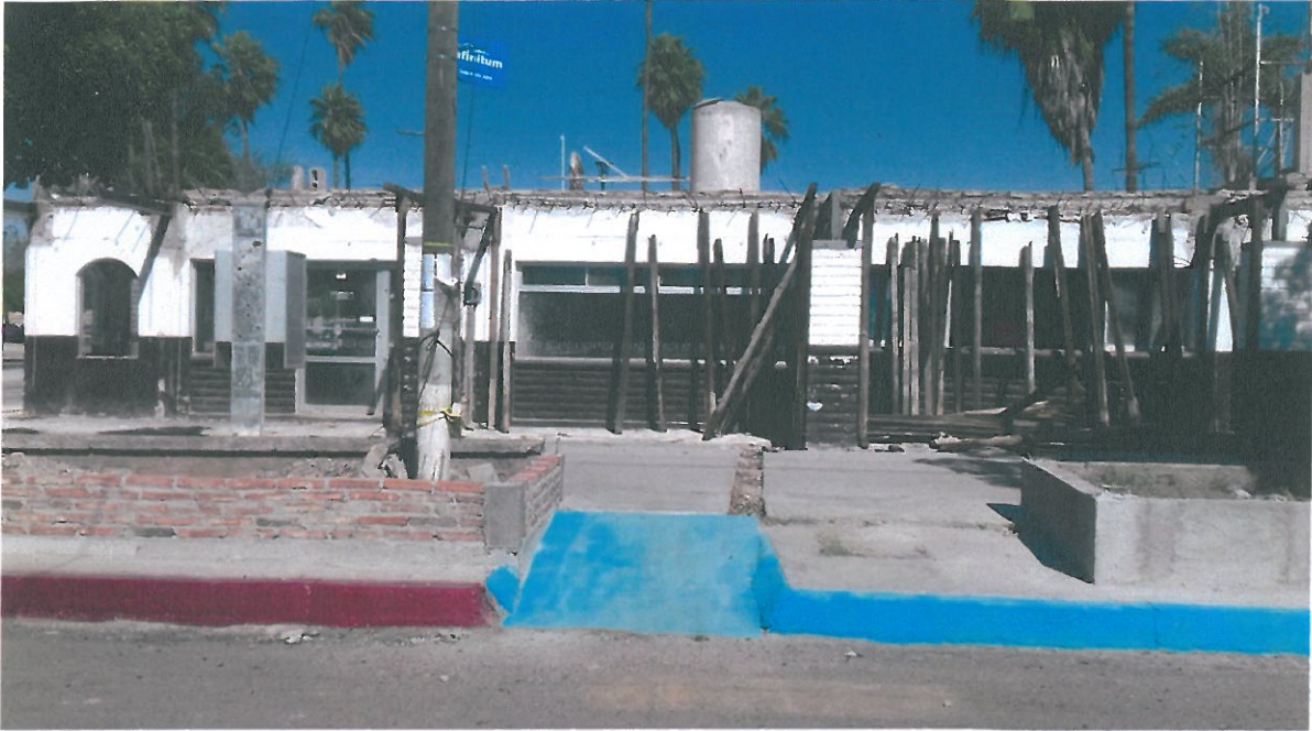
AVANCE QUE PRESENTA EN FACHADA PRINCIPAL LOCALES COMERCIALES