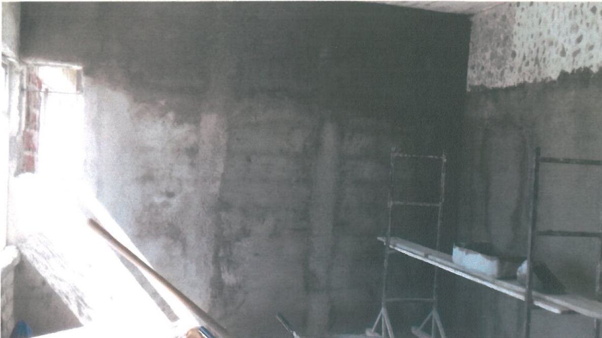
ENJARRE EN INTERIORES DE LOCAL # 2.