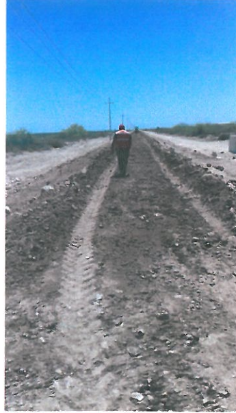
TRABAJOS EN CAPA DE TERRAPLEN