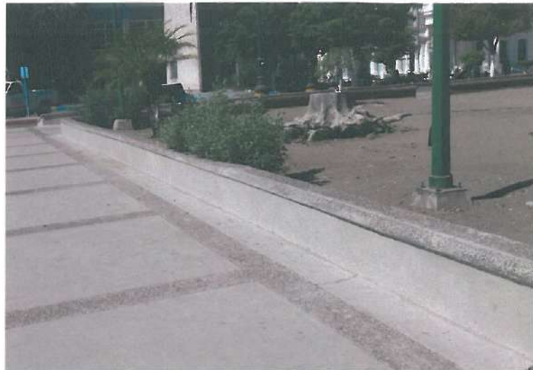
RELIZACION DE ARRIETES Y DETALLADO EN ARRIETES EXISTENTES (ENJARRE Y PINTURA)

OBRA: "CONSTRUCCION DEL CENTRO INTEGRAL DE PROCURACION DE JUSTICIA EN LA LOCALIDAD Y MUNICIPIO DE HUATABAMPO, SONORA"