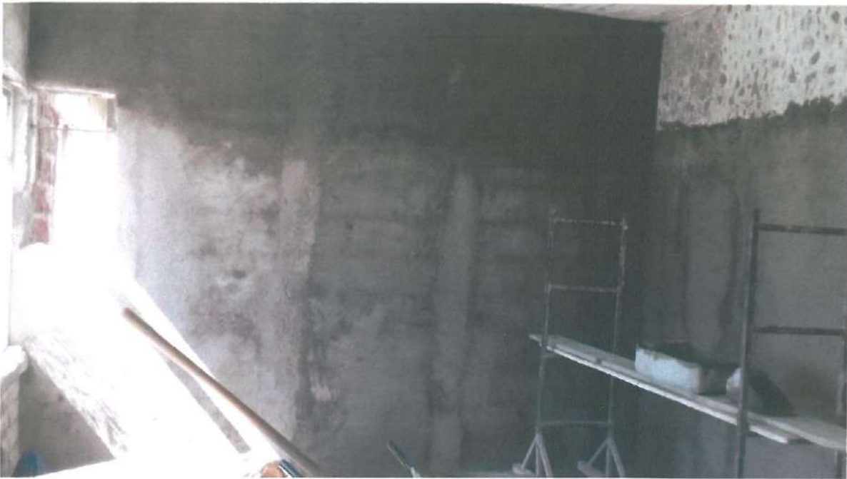
ENJARRE EN INTERIORES DE LOCAL # 2.