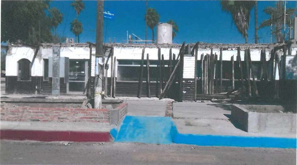
AVANCE QUE PRESENTA EN FACHADA PRINCIPAL DE LOCALES COMERCIALES