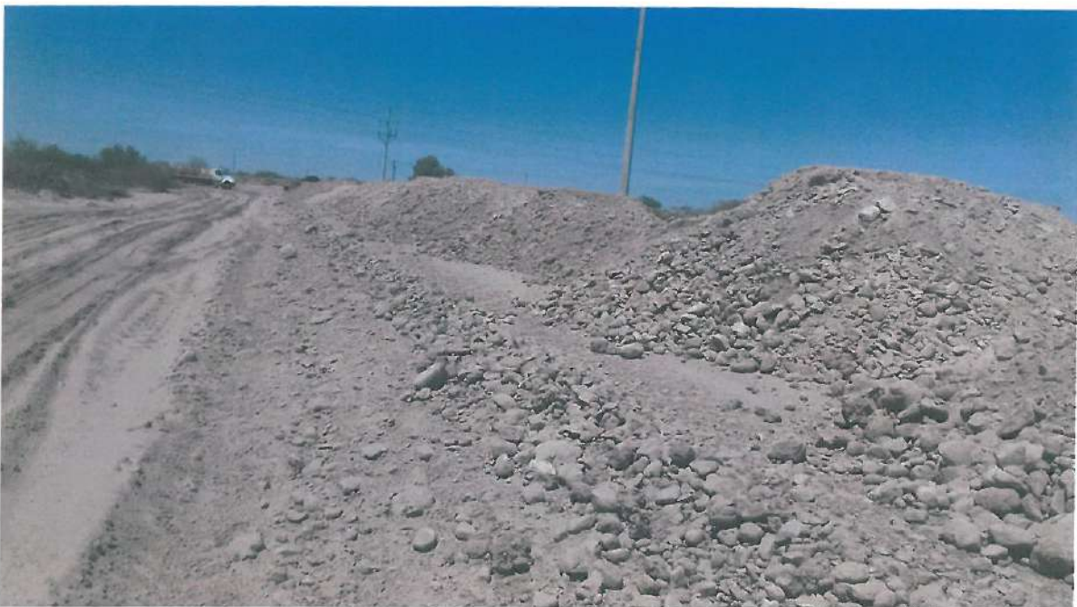
SE APRECIA SUMINISTRO DE MATERIAL DE SUBRASANTE CON SOBRETAMAÑO

Avance que presenta los trabajos al momento de la visita