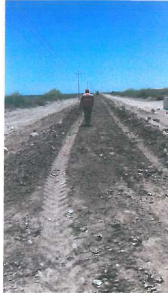
TRABAJOS EN CAPA DE TERRAPLEN