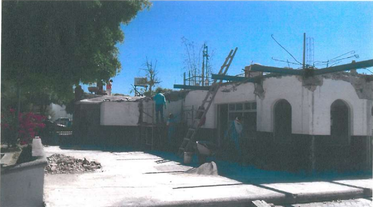
COLOCACION DE LADRILLO PARA DAR NIVEL A LOSA DE AZOTEA Y EN PRETIL, EN LOCALES COMERCIALES.