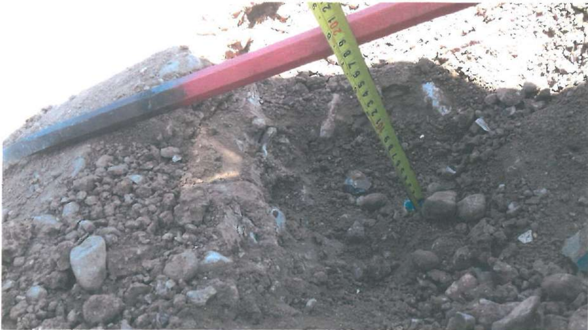
TOMA DE MUESTRA DE CAPA SUBRASANTE, PARA DETERMINAR SU CALIDAD