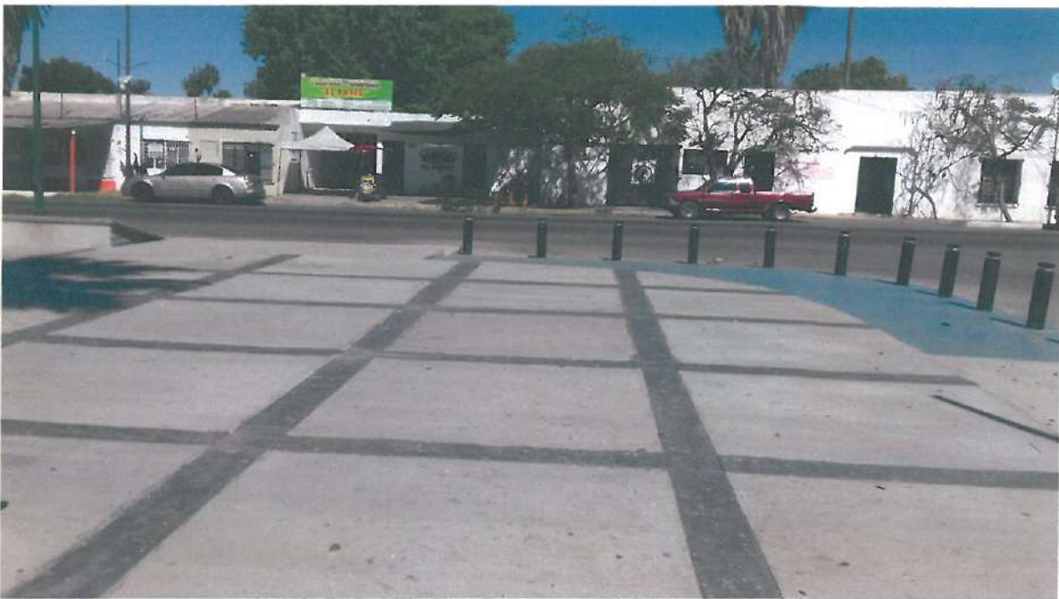
PISO DE CONCRETO EN ESQUINA NORORIENTE DE PLAZA