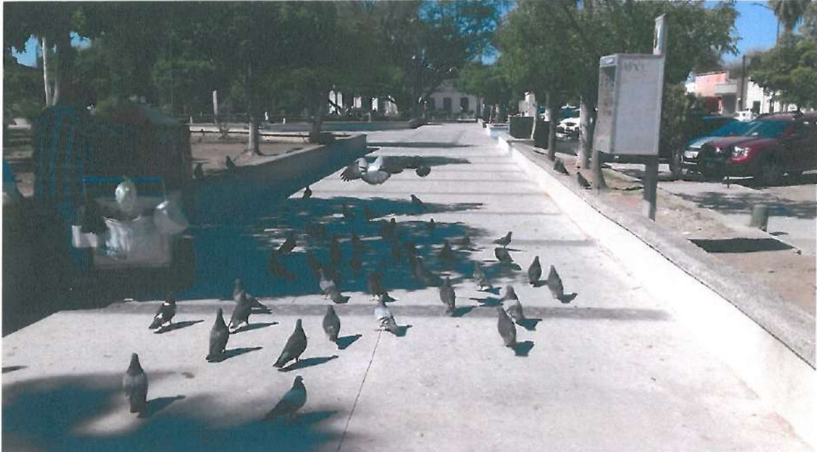
PISO DE 10 CM DE ESPESOR, EN LADO PONIENTE DE PLAZA.