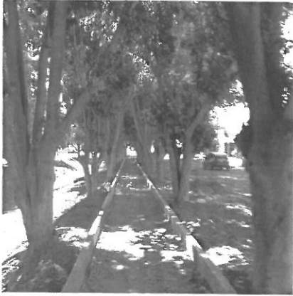
Recorrido de la obra