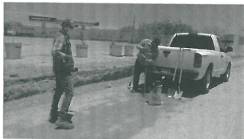
Se realizó cajón para muestreo y toma de espesor

Se realizó la verificación física a las obras: