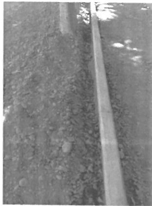
Colado de guarnición tipo I