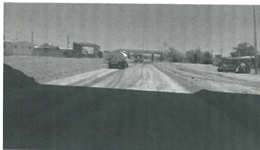
Trabajos de homogenización de material