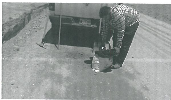
Muestreo de material mediante cajón.