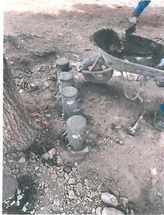
SE REALIZO LA PRUEBA DEL REVENIMIENTO DEL CONCRETO Y TOMA DE MUESTRAS DE CUATRO CILINDROS DE CONCRETO PARA SU FUTURO ENSAYE