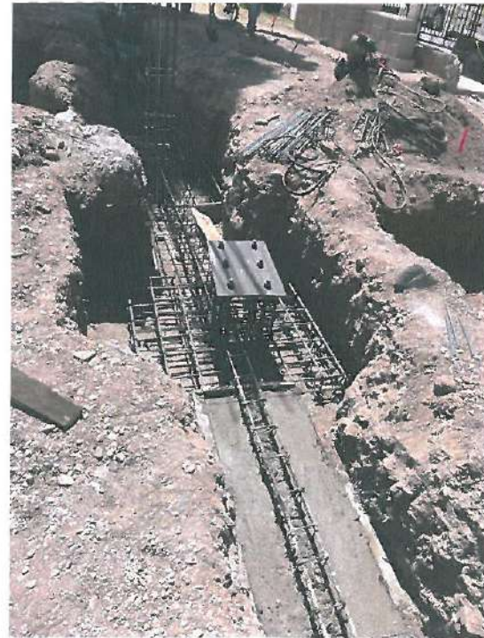
COLOCACION DEL CONCRETO CRETO EN ZAPATAS CORRIDAS Y ZAPATAS AISLADAS