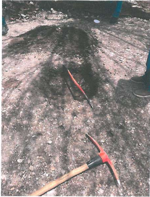
CALLE ENCINOS EN LA CUAL YA ESTABA TENDIDA LA CAPA DE BASE MAS NO ESTABA COMPACTADA, TOMAMOS MUESTRA PARA LA DETERMINACION DE SU CALIDAD

El día 27 de mayo del presente año, habiéndose concluido las actividades de verificación física de las obras, se realizó traslado a la ciudad de Hermosillo, Sonora