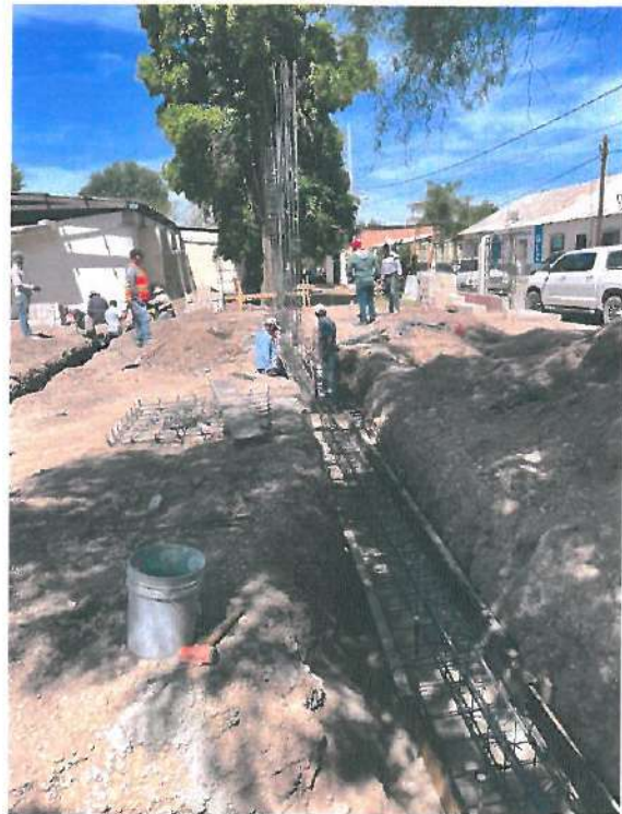
COLOCACION Y ARMADO DE ZAPATAS CORRIDAS Y AISLADAS EN PLANTILLA DE CONCRETO POBRE F'C 100 KG/CM 3