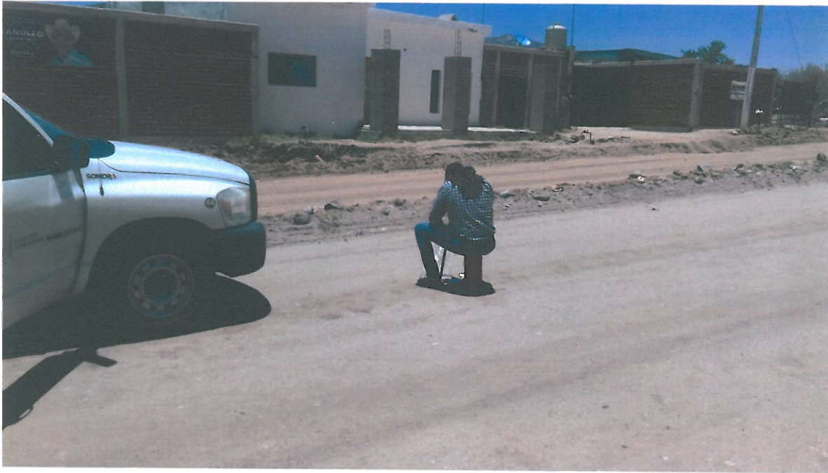
REALIZACION DE CALA PARA DETERMINAR SU GRADO DE COMPACTACION, EN CAPA DE BASE (CUERPO ORIENTE).