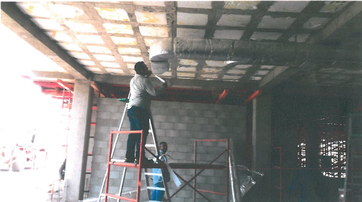
COLOCACION DE DUCTERIA