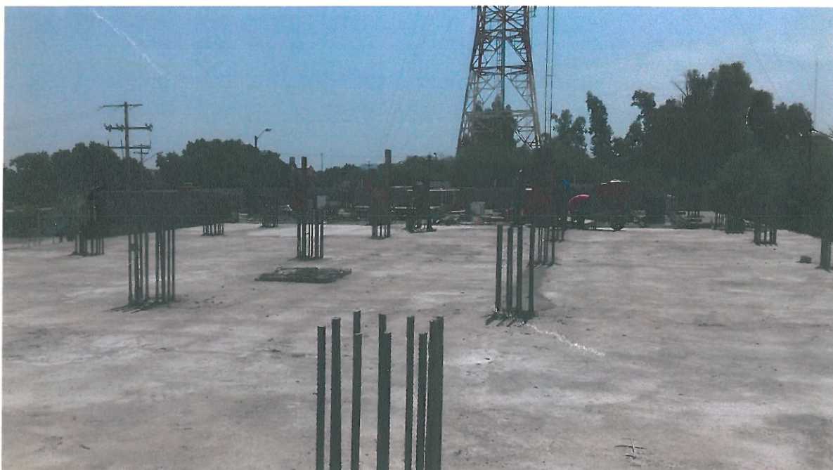
VISTA GENERAL EN LOSA DE ENTREPISO