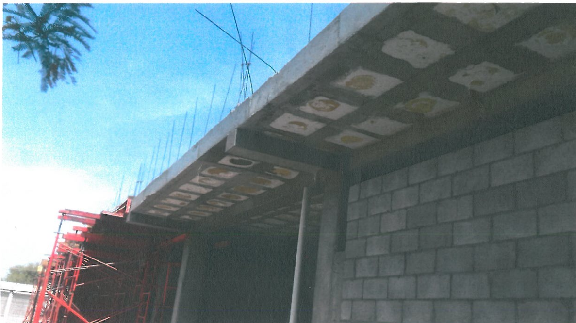
PARTE INFERIOR DE LOSA NERVADA DE ENTREPISO