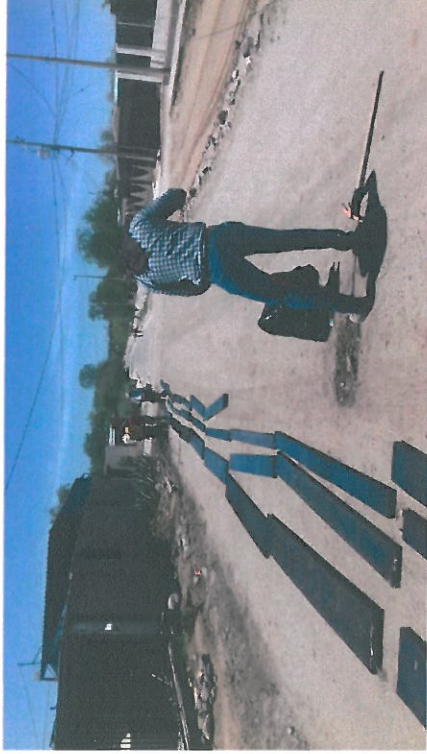
REALIZACIÓN DE TOMA DE MUESTRA DE CAPA DE BASE HIDRAULICA PARA VERIFICACIÓN DE CALIDAD DEL MATERIAL