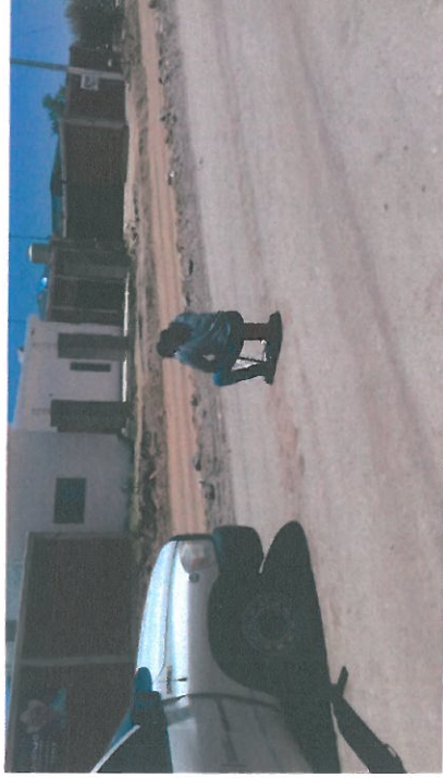
TOMA DE CALAS EN CAPA DE BASE HIDRAULICA (IZQUIERDA) Y TERRAPLEN (DERECHA) PARA DETERMIANACIÓN DE GRADO DE COMPACTACIÓN