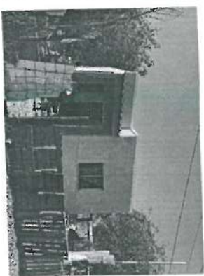
Red de Agua Potable y Vivienda en Varias Localidades

Posteriormente terminada la verificación física, el día 02 de julio nos trasladamos a Hermosillo, Sonora.