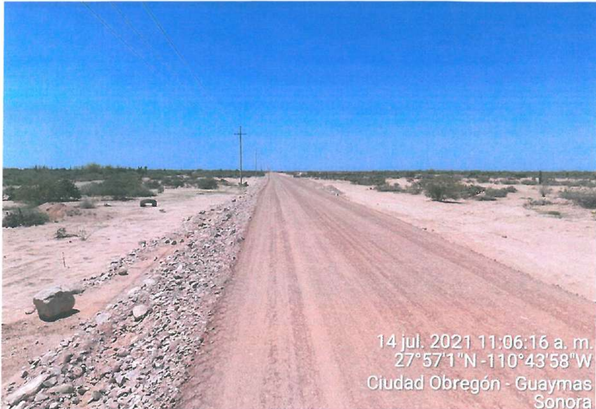
VISTA PANORAMICA DE LA OBRA

Contratista: JUNTA DE CAMINOS DEL ESTADO DE SONORA