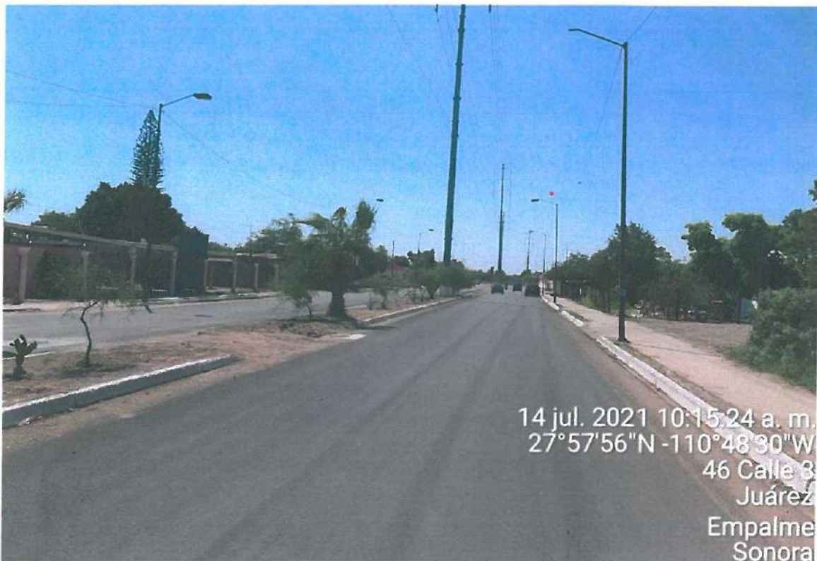
VISTA PANORAMICA DE LA OBRA

Se realizó el traslado el día 14 de julio al municipio de Empalme, sonora para realizar la inspección física de las siguientes obras: