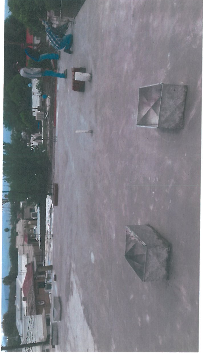
SE APRECIA PREPARACION PARA DUCTOS Y VENTILAS, EN LOSA DE AZOTEA.