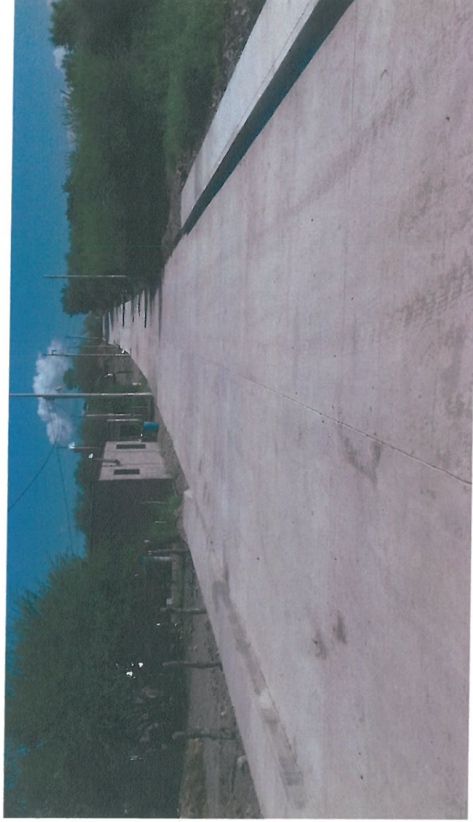
VISTA PANORAMICA DE LA AVENIDA SERDAN