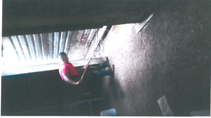
PREPARACION PARA LA INSTALACION ELECTRICA Y LIMPIEZA DE OBRA.