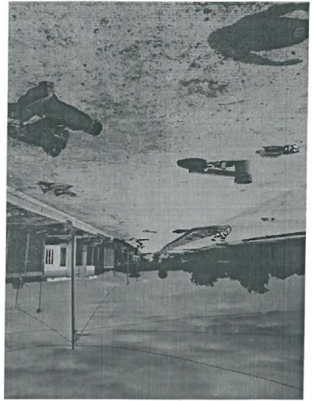
Informe No. ECOPE-DV-1440/2021 Hermosillo, Sonora, a 16 de Agosto de 2021