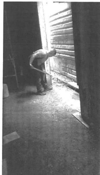
PREPARACION PARA LA INSTALACION ELECTRICA Y LIMPIEZA DE OBRA.