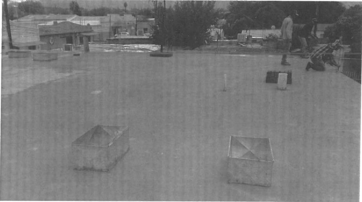
SE APRECIA PREPARACION PARA DUCTOS Y VENTILAS, EN LOSA DE AZOTEA.