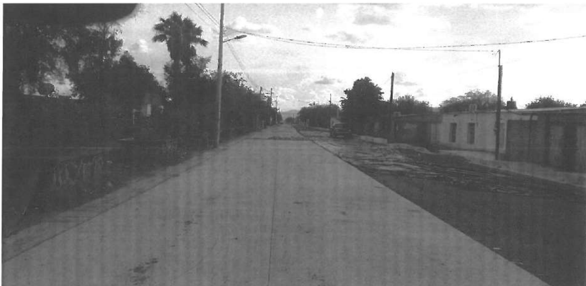
AVANCE QUE PRESENTA CALLE AMERICA