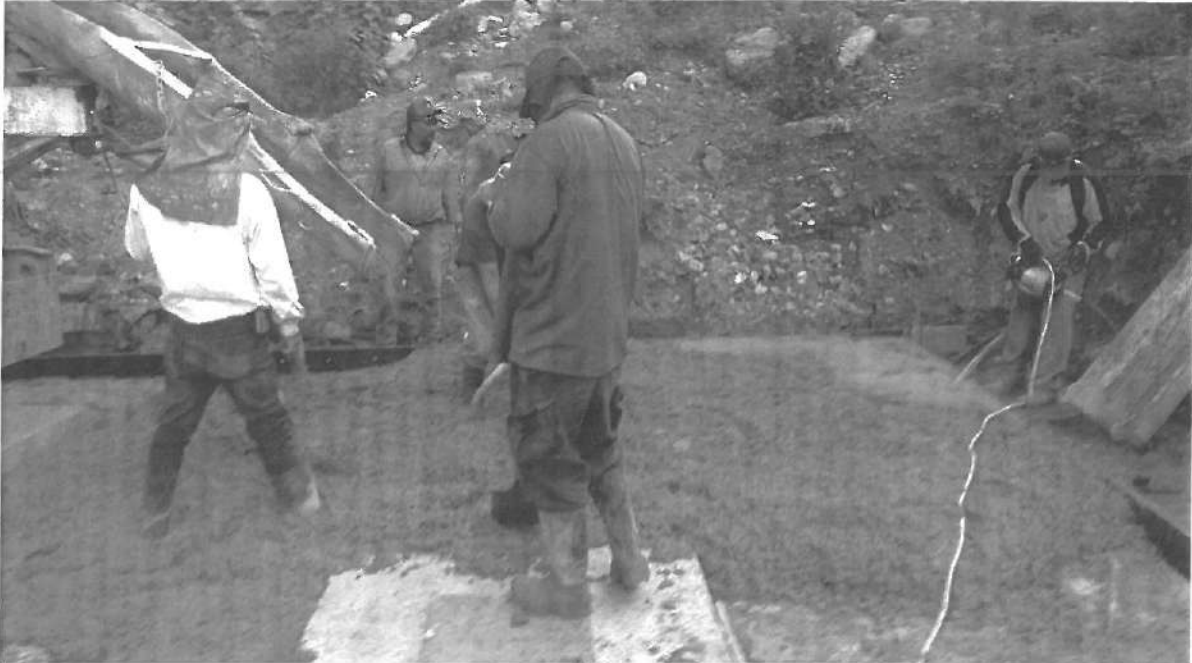
COLADO DE LOSA DE PAVIMENTACION, EN CALLE SIN NOMBRE.

Posteriormente se realizó el traslado al municipio de Tepache, para realizar la inspección física de la obra: