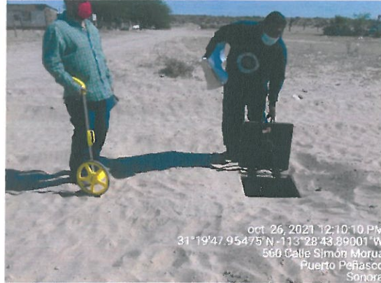
Medición de línea de agua y ubicación de caja de valvula.

OBRA: Ampliación de Alcantarillado en Colonia Hombres Blancos en la Localidad de Sonoyta, Municipio de General Plutarco Elías Calle.