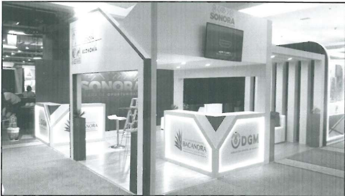
Stand de la Secretaría de Economía; Dirección General de Minería (DGM).