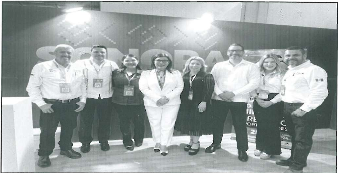
Personal de la Secretaría de Economía, en la inauguración del stand SONORA .