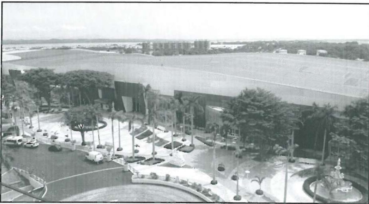
Sede del evento Mundo Imperial, Acapulco, Guerrero; México.

El 100% del programa de actividades, relacionadas con este gran evento, NO se realizaron, debido a los embates y daños materiales, ocasionados por el Huracán Otis (categoría 5); en todo el Puerto de Acapulco.