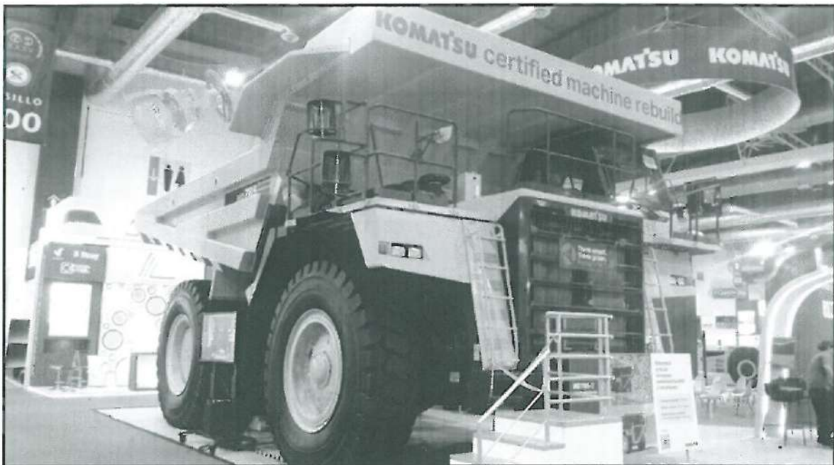
Camión minero Komatsu (Yukle), en el área de exposición.