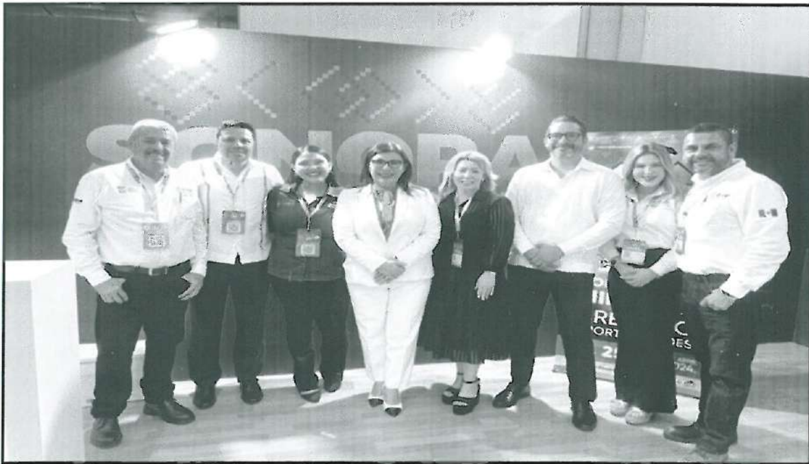
Personal de la Secretaría de Economía, en la inauguración del stand SONORA.

Todo esto para que se intercambien conocimientos a través de conferencias y conversatorios y celebren nuevas relaciones de negocios, mediante una exhibición de productos y servicios. Además de aspectos tecnológicos, ambientales, jurídicos y sociales; para el sector minero.