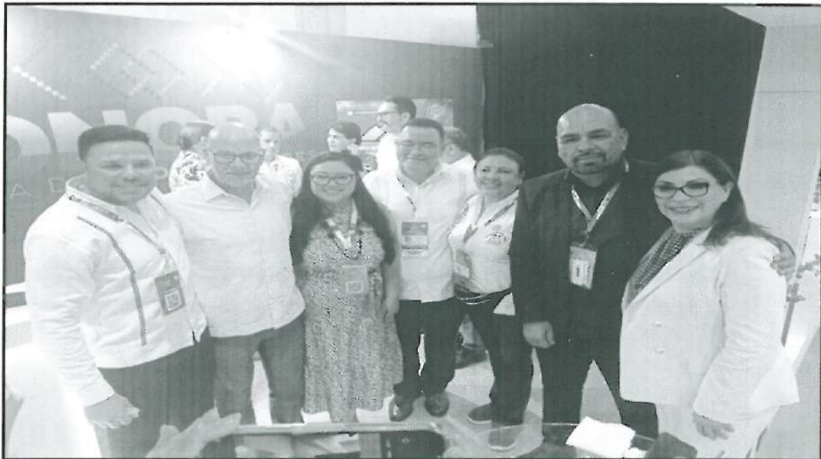
Presencia de Personalidades del sector minero, en el stand de la Secretaría de Economía (DGM y CSRB).