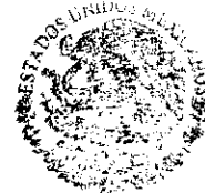
C.P. JAVIER TAPIA CAMOU

COMISION DE FOMENTO AL TURISMO DEL ESTADO DE SONORA