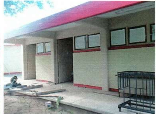
Taller de programación de software y bodega