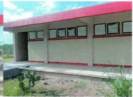
Aula y Laboratorio de Idiomas