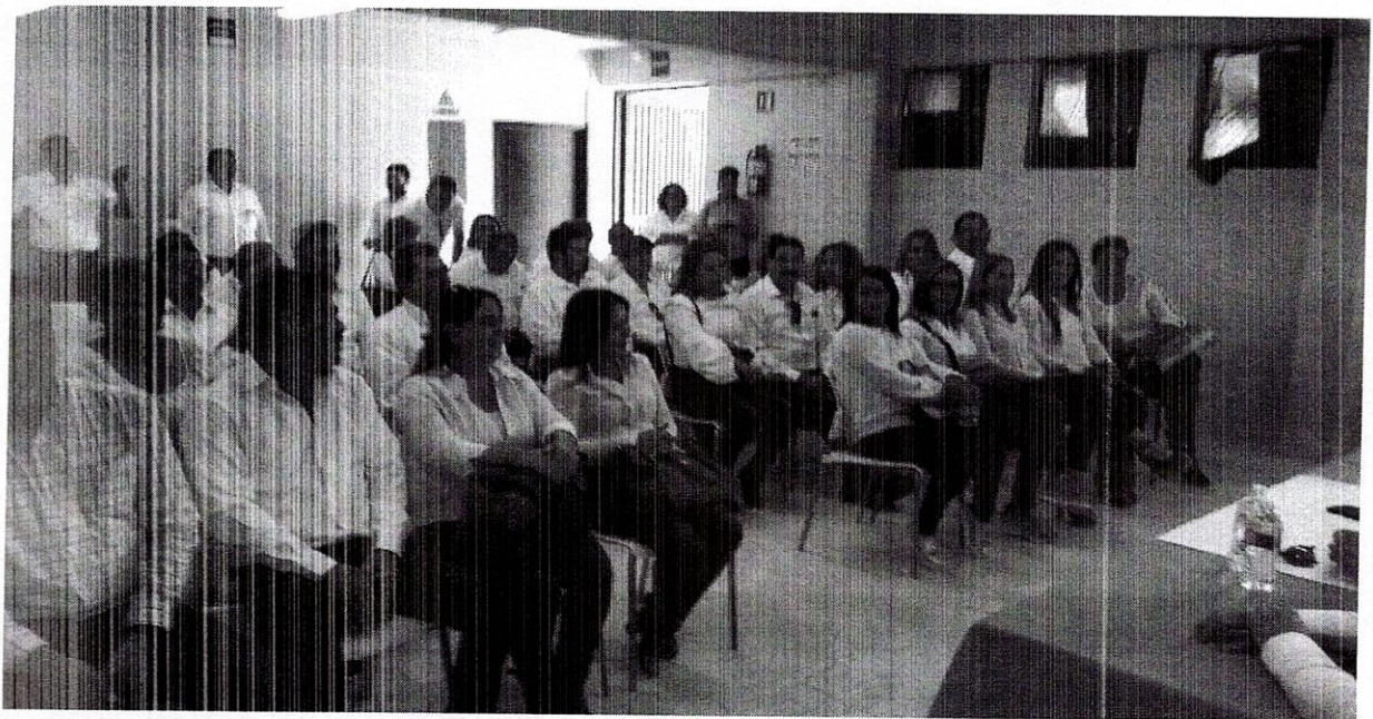
Reunión de capacitación y seguimiento de indicadores académicos y financieros