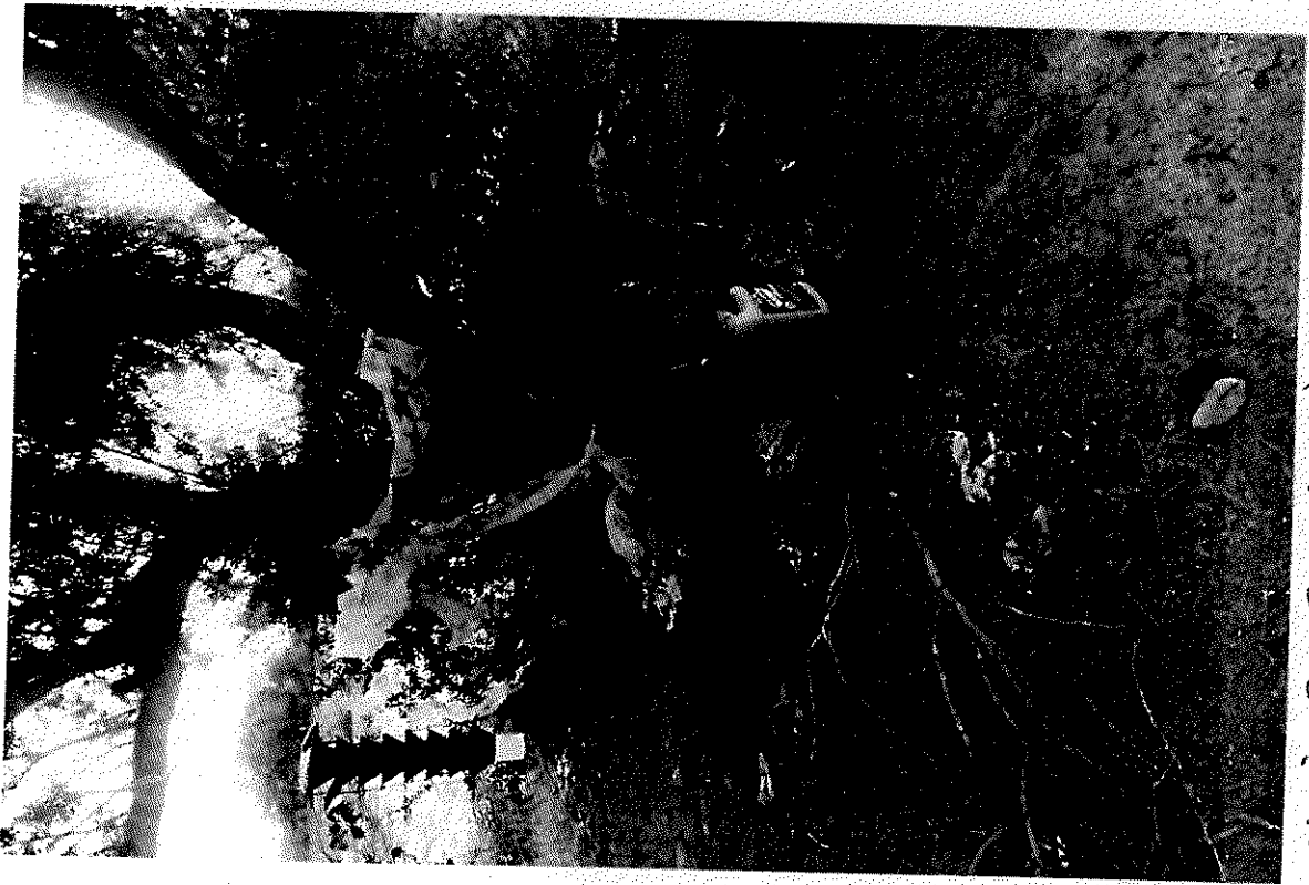
OFICIO DE COMISION N° 12/04-0144-2019- DE FECHA 11 DE MARZO 2019 FECHA DE COMISION 15 DE MARZO 2019