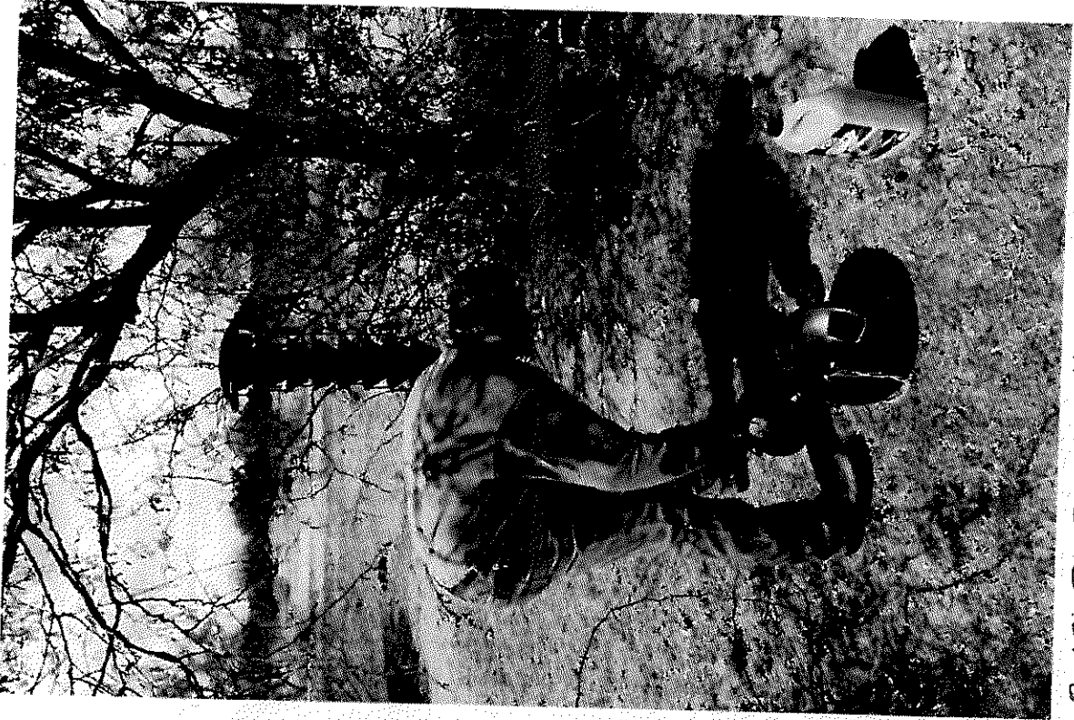
OFICIO DE COMISION N° 12/04-0144-2019- DE FECHA 11 DE MARZO 2019 FECHA DE COMISION 15 DE MARZO 2019