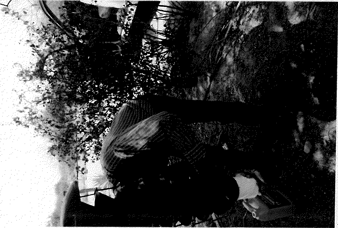
NO OFICIO DE COMISION 12/04--0153 DE FECHA 19-MARZO-2019 FECHA DE COMISION 22-DE-MARZO-2019