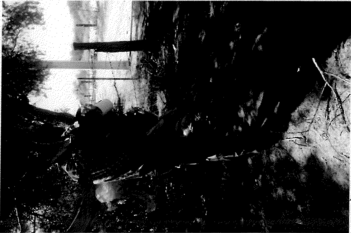
FECHA DE COMISION 28 DE MARZO 2019