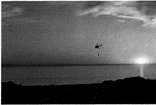
Llegada del helicóptero con una hembra