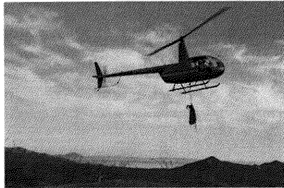
Llegada del helicóptero con un macho de borrego

En cuanto llega el ejemplar a tierra se le recibe con un baño de agua con alcohol mediante una bomba atomizadora con el propósito de bajar la temperatura interna provocada por el estrés al que se somete al momento de la persecución y captura, posteriormente, se le toma una muestra de sangre y se le aplica un tratamiento profiláctico (antibióticos, desparasitantes, vitaminas, desinflamatorios y bicarbonato), se le coloca un collar satelital y se le pone un arete numerado y finalmente se libera al medio silvestre.