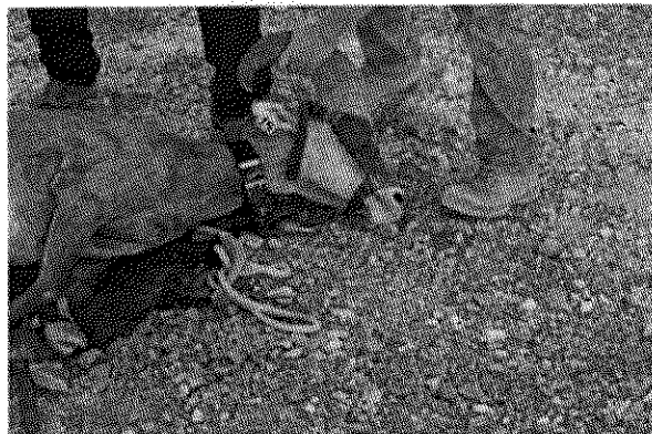
Borrego macho con collar y arete

En cuanto llega el ejemplar a tierra se le recibe con un baño de agua con alcohol mediante una bomba atomizadora con el propósito de bajar la temperatura interna provocada por el estrés al que se somete al momento de la persecución y captura, posteriormente, se le toma una muestra de sangre y se le aplica un tratamiento profiláctico (antibióticos, desparasitantes, vitaminas, desinflamatorios y bicarbonato), se le coloca un collar satelital y se le pone un arete numerado y finalmente se libera al medio silvestre.