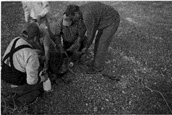
Manejo de un ejemplar hembra de borrego cimarrón