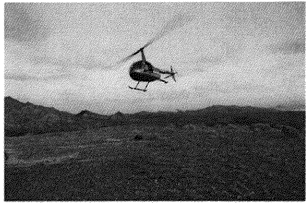
Depositando en tierra a hembra de borrego