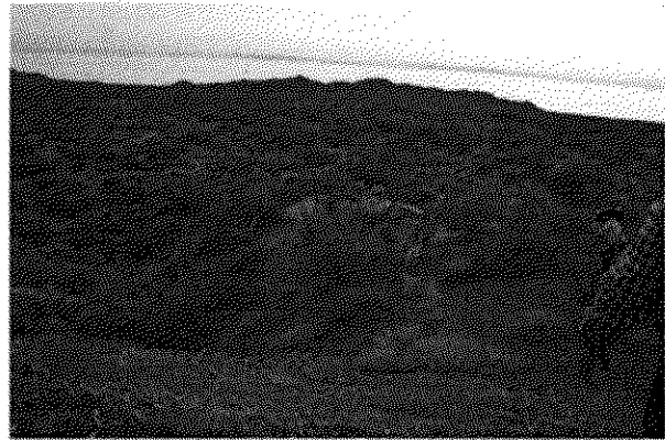
Liberación después del manejo

Finalmente, después del manejo nos retiramos del lugar ya que al día siguiente continuarían con la captura y aplicación de collares en las UMA programadas en las zonas borregueras en el Estado de Sonora.