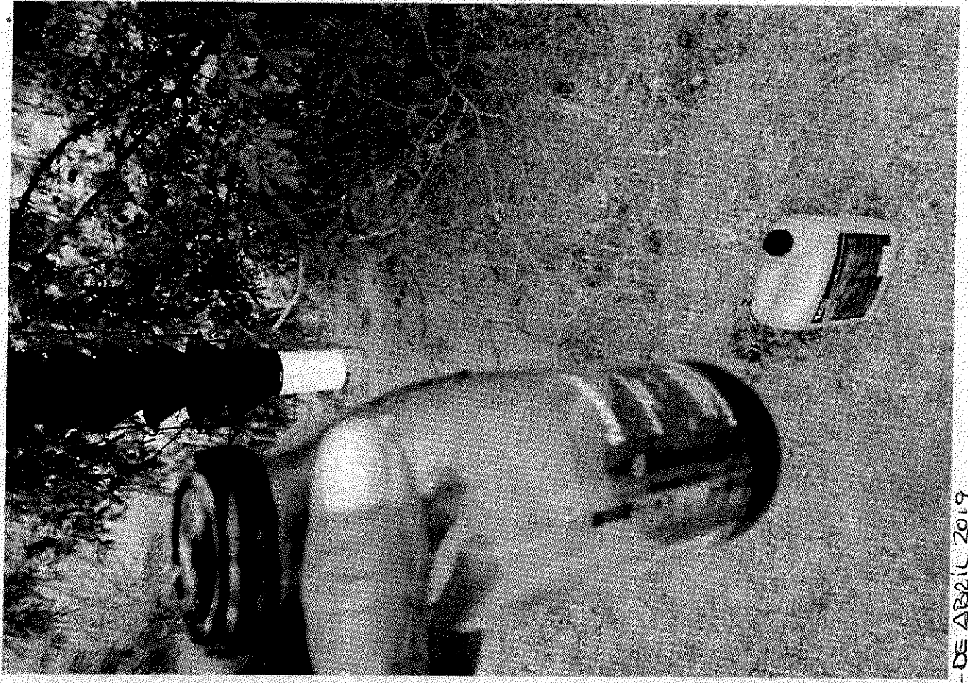
OFICIO DE COMISION No 12/04-0197 DE FECHA 10-DE ABRIL 2019