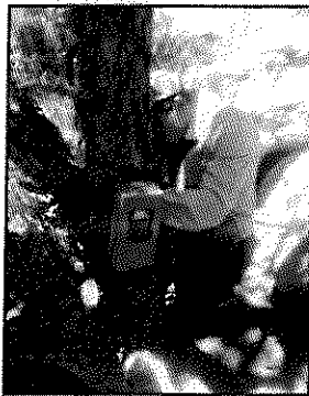
Foto: Revisión de cámara trampa.

Los resultados: Se realizó con éxito la revisión de 30 cámaras trampa en el Rancho Las Águilas, para reemplazar baterías e intercambio de memorias SD en el marco del proyecto de "Inventario y Monitoreo de la Fauna Silvestre de los Ecosistemas Serranos del Centro-Noreste del Estado de Sonora". Asimismo, se realizó la limpieza del sitio y toma de datos como vegetación, condiciones climatológicas al momento de la revisión de las cámaras, entre otros aspectos. Dichas cámaras son la herramienta principal para la implementación del proyecto de "Inventario y Monitoreo de la Fauna Silvestre de los Ecosistemas Serranos del Centro-Noreste del Estado de Sonora" durante un periodo de tres años con la finalidad de hacer un inventario (el primer año) y posteriormente un monitoreo (segundo y tercer años) de la fauna silvestre en los hábitat diversos del archipiélago madreño en el Estado de Sonora, como parte de las líneas de acción del Comité de Agronegocios y Vida Silvestre dentro del marco de la Comisión Sonora-Arizona.