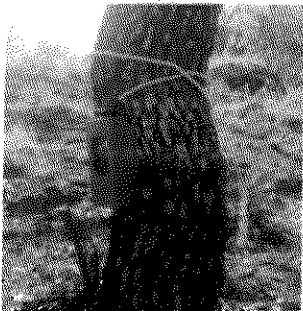
Foto2: Cámara trampa revisada.

Finalmente, anexo oficio de comisión No. 12/04-0315/2019 con la firma del administrador de la UMA La Cieneguita de los Janos, ubicado en el municipio de Cucurpe, Sonora, e identificación oficial, como comprobante de pernocta, así como el comprobante de gasolina. No se utilizaron casetas de peaje, ya que se tomaron vías alternas.