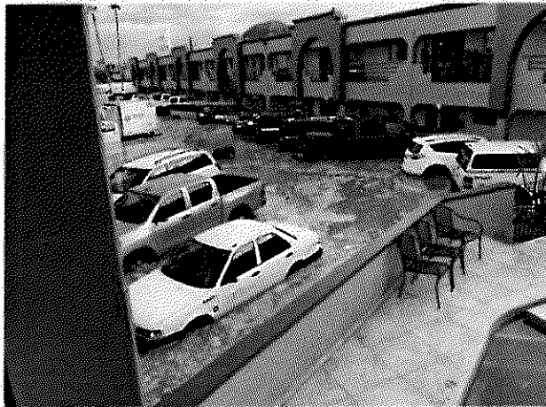
VISTA EXTERIOR DEL HOTEL INUNDADO