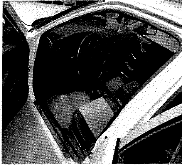
VEHICULO TSURU CON AGUA EN INTERIORES