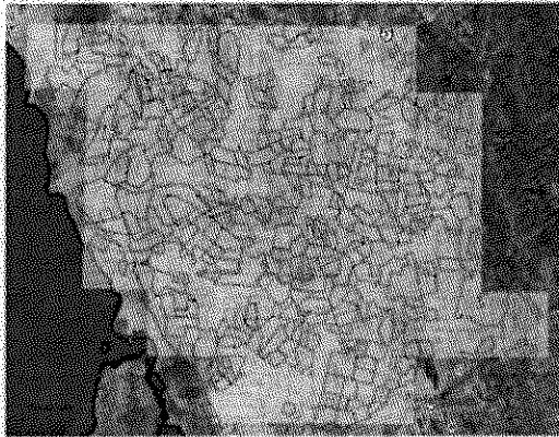
Región norte del Estado de Sonora

Por cuestiones climatológicas presentadas en esas fechas se pospuso dicha comisión para los días del 22 al 25 de noviembre, iniciando el sobrevuelo para el monitoreo de la especie venado bura ( Odocoileus hemionus eremicus ) en el Estado de Sonora en la región norte la cual comprende del municipio de Caborca hasta el municipio de Plutarco Elías Calles.