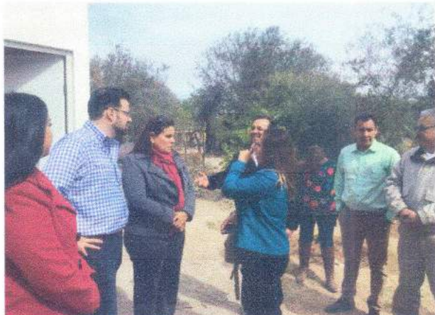
El Júpare, Huatabampo