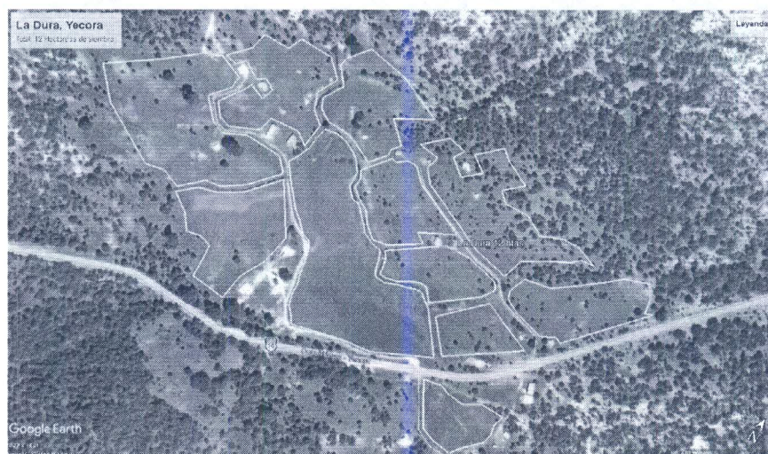
La Dura, Yecora. Tierras de siembra.

En la localidad de La Dura nos reunimos con algunos agricultores que se encontraban en el lugar, les explicamos la labor que estábamos realizando y nos comentaron varios puntos a tomar en cuenta, la mayoría de los agricultores se encontraban trabajando. Nos hicieron el comentario que había varias personas que no se encuentran ni como ejidatarios ni pertenecen a ningún padrón de SADER, pertenecientes a la etnia y teniendo la necesidad de sembrar su poquita parcela. Se estiman 12.00 hectáreas de tierra en la comunidad La Dura que regularmente se siembran.