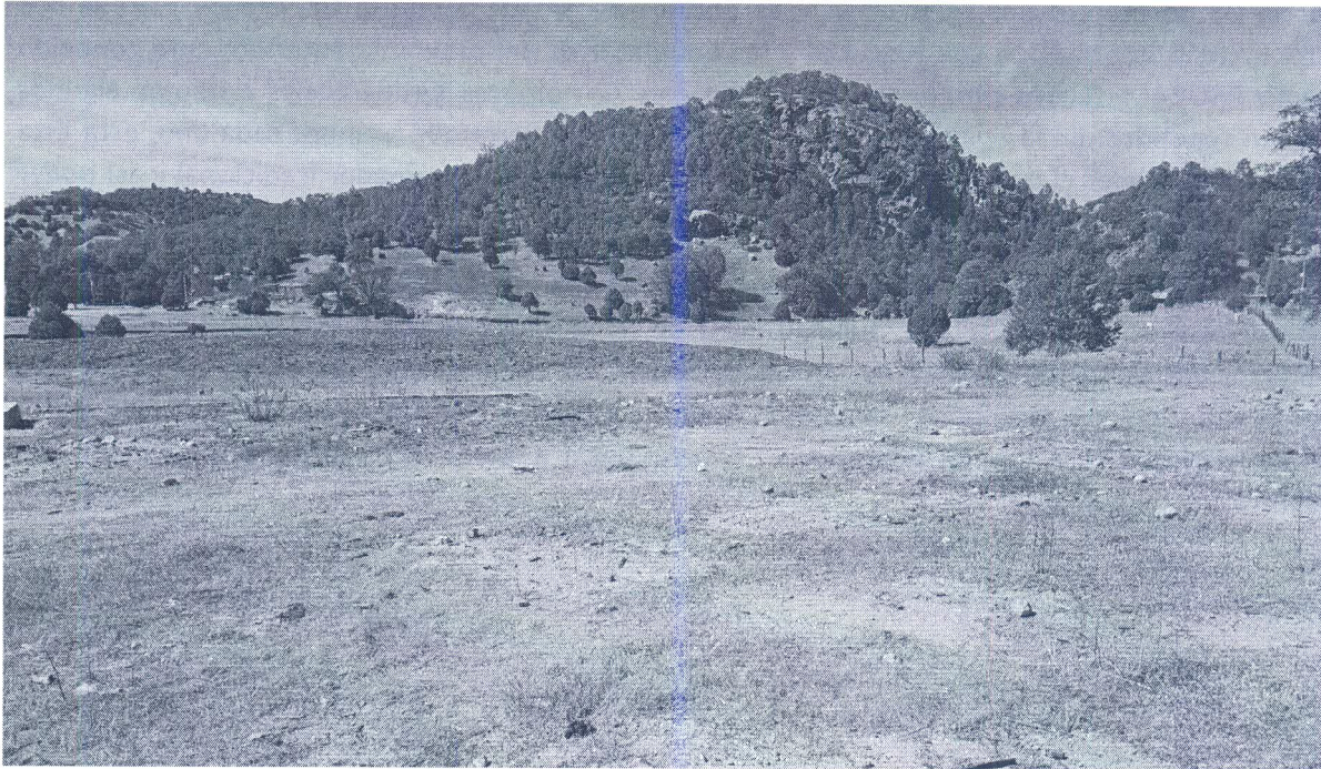
Kipor, Yecora. Tierras de Siembra

Posteriormente nos reunimos con agricultores en la localidad de Maycoba, en dicha reunión nos acompañó el Comisario Ejidal, quien nos daría la información exacta de los agricultores que pertenecen al ejido.