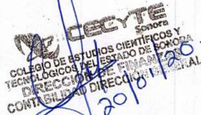
UBALDO PERALTA LOPEZ SUBDIRECTOR ADMINISTRATIVO

500150142. 1000026290 7900000 143 10000 10 30'