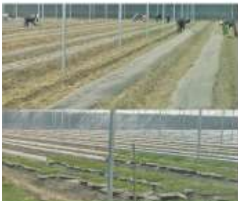
Invernadero en operación del grupo productivo indígena Agropecuaria Silkchive S.C.R.L. de la comunidad de Pótam, territorio Yaqui.