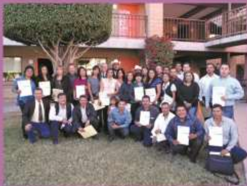
Jóvenes indígenas de seis etnias que concluyeron el diplomado en Gestores Locales para el Desarrollo Territorial en Áreas Indígenas.