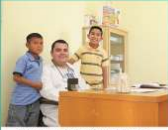
Atención de la salud de niños indígenas.

"8,938 indígenas beneficiados con las jornadas de salud"