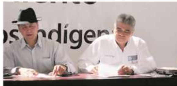
Convenio Interinstitucional entre la Secretaría de Salud-CDI-CEDIS para establecer las bases para una atención integral en salud a favor de los pueblos y comunidades indígenas.