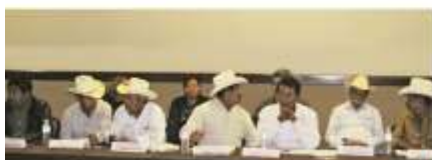
Algunos regidores étnicos en sesión de trabajo en el Consejo Consultivo de la CEDIS.

En obediencia al procedimiento de designación de regidores étnicos y atendiendo la solicitud del Consejo Estatal Electoral (CEE), la CEDIS presentó información relativa a los pueblos originarios asentados en los diversos municipios del Estado, dando con ello cumplimiento al artículo 181 del Código Electoral para el Estado de Sonora.