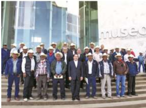
Reunión del secretario de gobierno, Roberto Romero López, con los 8 gobernadores yaquis, realizada en enero del 2013.