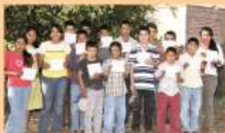
Niños indígenas después de recibir su beca.

Durante el ciclo escolar 2011-2012 se otorgaron 6,328 becas y en el lapso entre los ciclos educativos 2009-10 y 2011-2012 se han otorgado 18,062 becas en beneficio de estudiantes indígenas, en acción transversal con el Instituto de Becas y Estímulos Educativos del Estado de Sonora (IBEEES), con una inversión de 48.5 millones de pesos. Cabe destacar que desde 2012 se ha implementado un nuevo proceso de selección de los beneficiarios y el pago de las becas de manera personalizada y directamente por funcionarios de la institución en sus propias escuelas. De los cuales, habrán de egresar en los cuatro niveles educativos (primaria, secundaria, preparatoria y universidad) entre los ciclos escolares 2009-2010 y 2012-2013, la cantidad de 5,912 jóvenes indígenas.