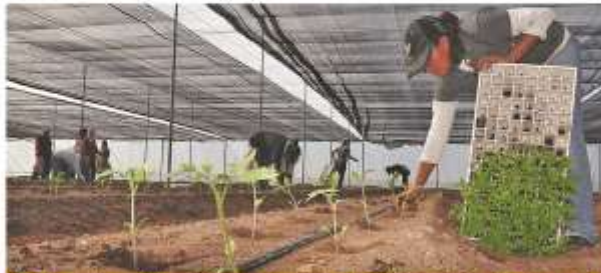
Malla sombra del megaproyecto Unión de Cooperativas Agropecuarias Bioespacio de Etchohuaquila, SC de RL de CV, en Navojoa, Son., inaugurado en septiembre de 2012, generando 160 empleos directos con una inversión global de 60 millones de pesos aportados por Sagarhpa, Sagarpa, Financiera Rural y Sedesol.

Entre 2009 y 2012 se han otorgado 360 financiamientos a proyectos por un monto de 42 millones 916 mil pesos, promoviendo con ellos 1,031 empleos directos; de los cuales 24 son de gran impacto y se financiaron en el marco de los convenios interinstitucionales con la CDI en el PROCAPI, con participaciones de Sagarpa, Sagarhpa y Financiera Rural.