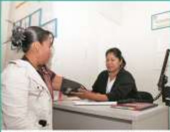
Estudios médicos entre localidades indígenas.