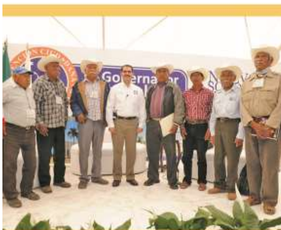
Reunión del gobernador del estado, Guillermo Padrés Elias, con gobernadores tradicionales mayos, realizada en marzo de 2012.