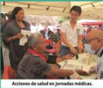
Acciones de salud en Jornadas médicas.