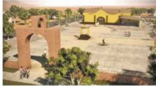
Diseño de la plaza de Etchojoa, Son., en el proyecto ejecutivo Ruta de peregrinación fiestas de la Santísima Trinidad del Pueblo Mayo.

Adicionalmente, para 2013 iniciarán los trabajos del proyecto Ruta de peregrinación fiestas de la Santísima Trinidad del Pueblo Mayo que se lleva a cabo anualmente entre Etchojoa y El Júpate, en la que participan alrededor de 30 mil indígenas mayos. Para empezar, se destinarán 5 millones de pesos en la remodelación de la iglesia de Etchojoa, Son. El proyecto en su totalidad requerirá de una inversión de casi 35 millones de pesos.