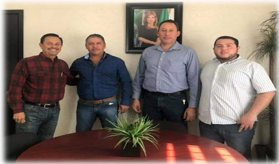
Reunión con el Presidente Municipal de Quiriego, Leonardo Flores García, para coordinar esfuerzos a favor de las comunidades indígenas.