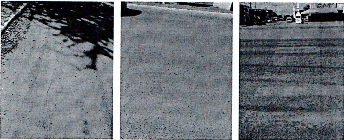
Imagen.- Deficiencia técnica Grietas en carpeta, Desprendimiento de vialetas, Desprendimiento de vialetas en Blvd. Rafael J. Almada

Periodo de ejecución: 25 de mayo al 20 de noviembre de 2018