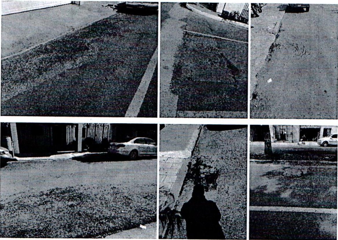
Imagen.- Deficiencias técnicas en Calles Hortensia, Clavelina, Crisantemo, Dalia, Gardenia, Margarita y Blvd. Birsas

Periodo de ejecución: 24 de mayo al 19 de diciembre de 2018