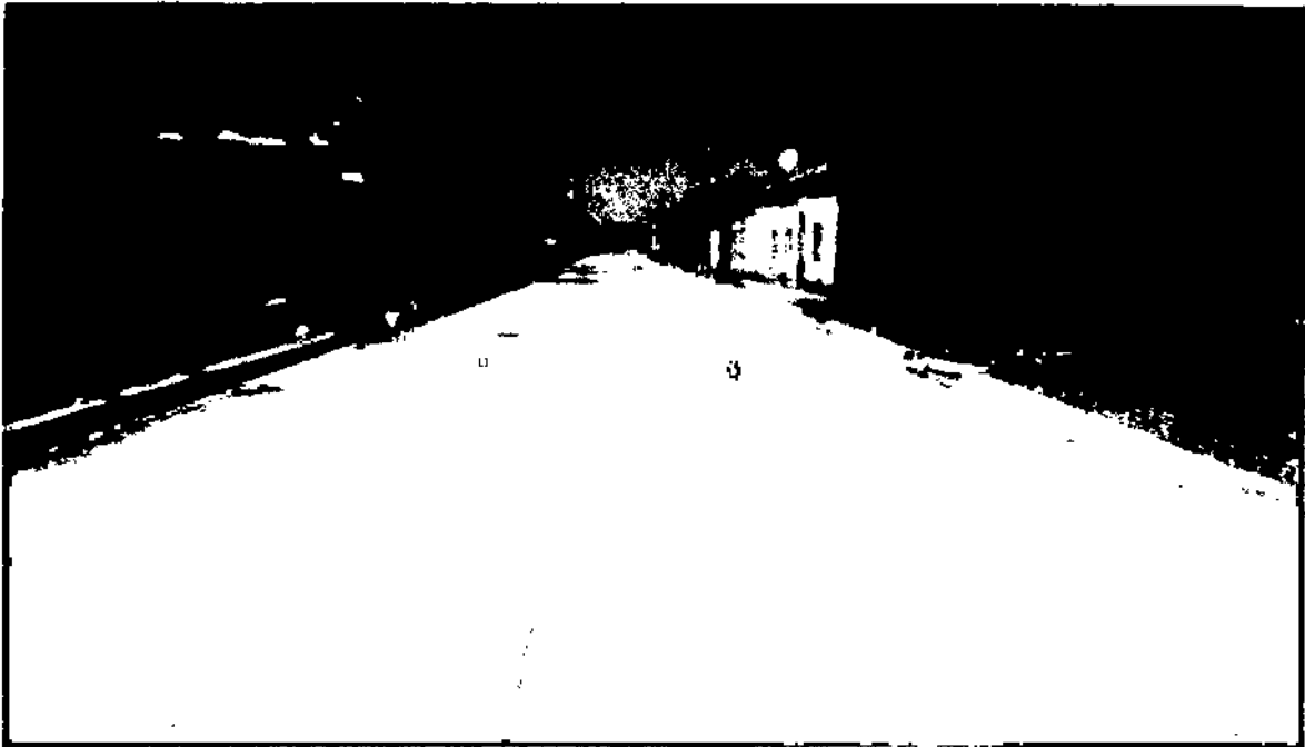
Concreto hidráulico en calle Ignacio Pesqueira, se aprecia en área de banqueta sin colar.