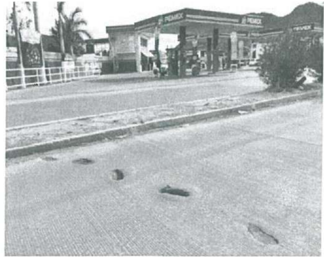
En estas fotografías se aprecia detalles de Huellas en Losa de pavimento de Concreto Hidráulico con resistencia F'c=250 \text{ kg/cm}^2 TMA 40 mm