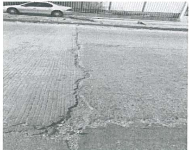
En estas fotografías se aprecia Mal corte uniforme en Losa de 20 cms de espesor en Concreto hidráulico, así la falta de sello en la unión de Junta.