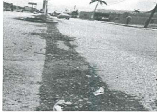
En estas fotografías se aprecia corte de Concreto Hidráulico, así mismo Falta Retiro de Material Producto de Corte en Pavimento.