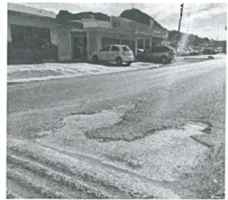
En estas fotografías se aprecia la mala calidad por demasiado desgaste en Microcarpeta de 3.0 cm de espesor.