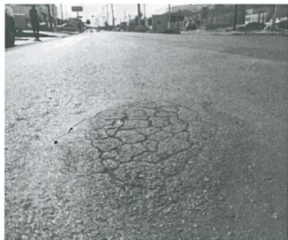
En estas fotografías se aprecia baches en Microcarpeta de 3.0 cm