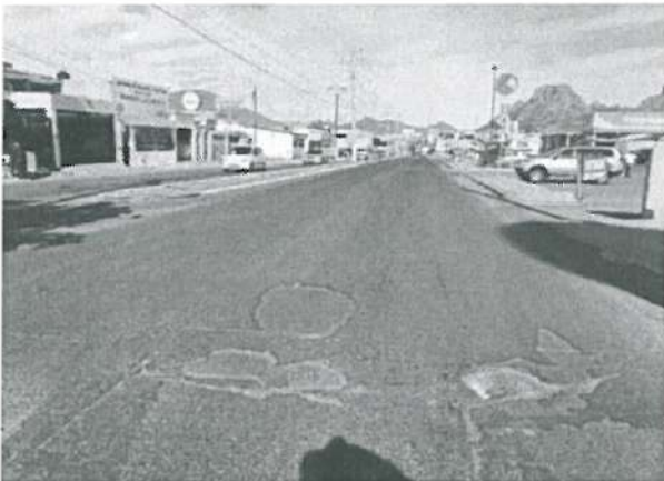
En esta fotografía se aprecia Huecos en Micro carpeta de 3.0 cm

En los tramos Bulevar Benito Juárez se aprecian daño en losa de concreto hidráulico, se presentan grietas, falta de sello en algunas juntas, falta limpieza de escombros, por lo cual se recomienda sean atendidas a la brevedad posible para así evitar posible observación.