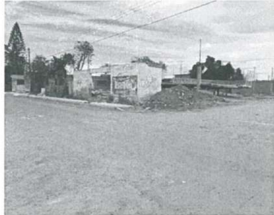
En estas fotografías se aprecia que se requiere limpieza General, así como retiro de material Producto de los Trabajos de Excavación.