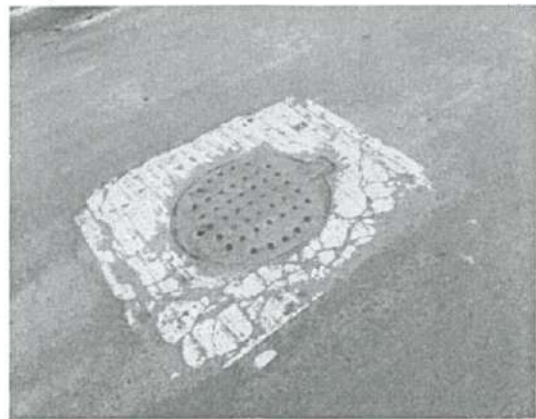
En estas fotografías se aprecia daño en Losa de Concreto de Resistencia F'c = 150 \text{ Kg/cm}^2 T.M.A 3/4"