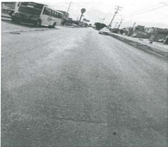
En esta fotografía se aprecia las diferencias de Nivel en Micro carpeta, Carril Izquierdo de Imagen.

Conclusiones: Se requiere a la contratista realizar los trabajos observados en el reporte de visita.