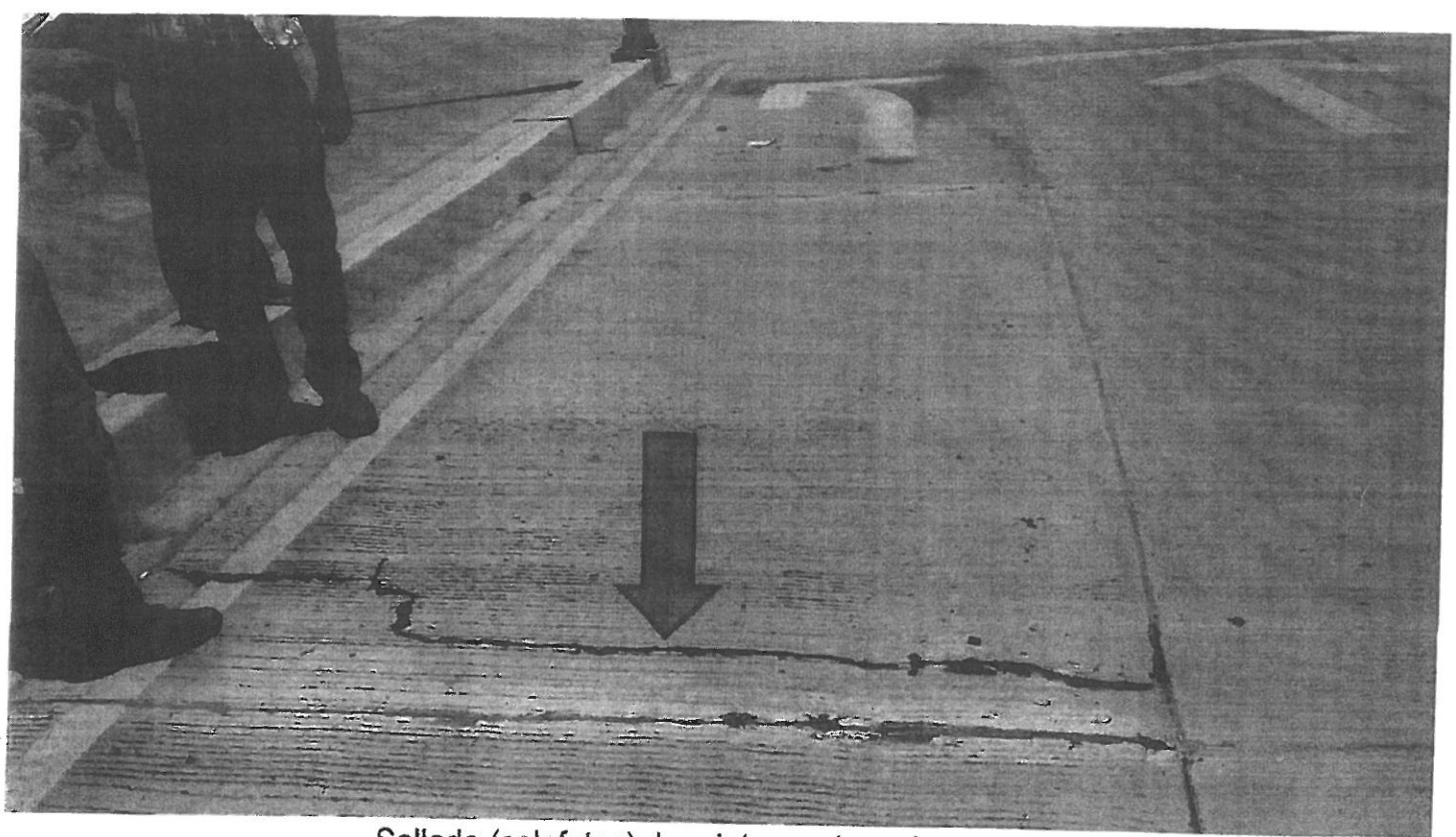
Sellado (calafateo) de grietas en losa de concreto

Ejecutora: DIRECCION DE INFRAESTRUCTURA URBANA Y OBRAS PUBLICAS.