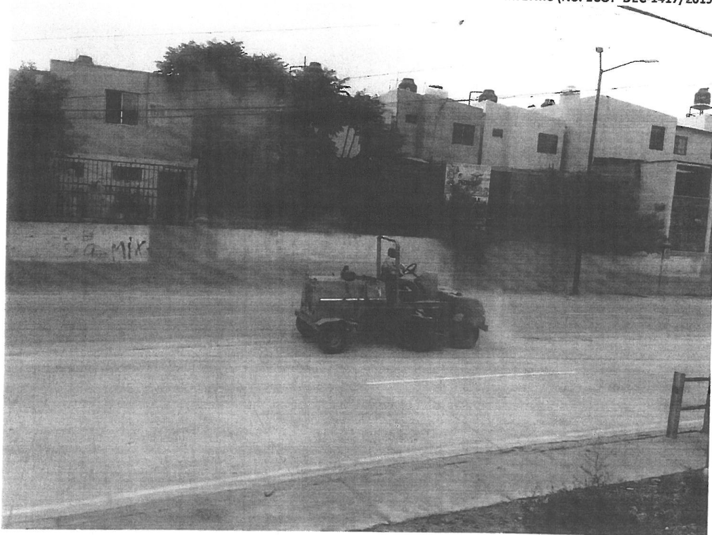
Limpieza con equipo mecánico ( barredora).

El día 06 de Agosto del presente año, habiéndose concluido las actividades de verificación física de la obra, se realizó traslado a la ciudad de Hermosillo, Sonora