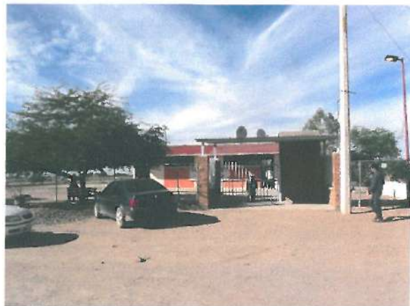
En la primera fotografía se observa el letrero de la obra y en la segunda foto se ve, la Escuela Primaria.