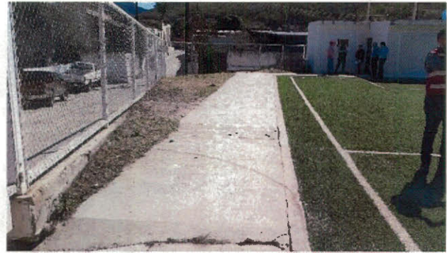
Vistas de Cancha de futbol

Seguidamente continuamos con la Rehabilitación del Palacio Municipal, los trabajos consistieron en muro de block en fachada principal, con aplanado de cemento-arena, recubierto con piedra laja y fachaleta adobo rojo, rampa para minusválidos, piso de loseta de cerámica, e instalaciones eléctricas (centro de carga, apagadores, contactos y salidas para alumbrado, del cual se detectaron conceptos pagados no ejecutados, el cual se asentó en acta de sitio.