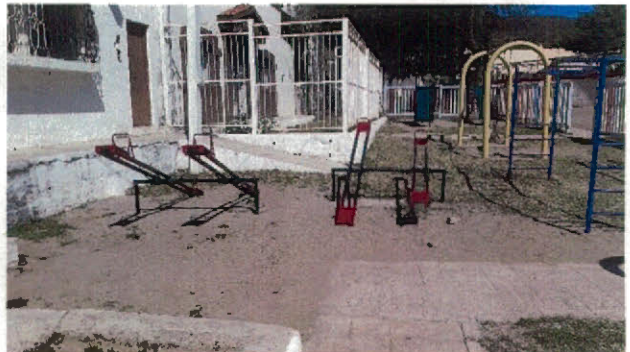
Vistas del exterior e interior del parque