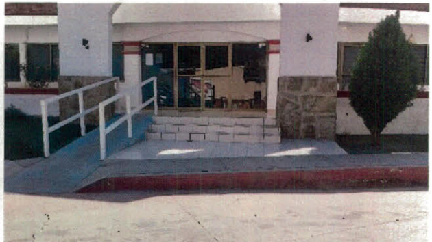
Vistas de la fachada de Palacio Municipal donde se realizaron los trabajos.

También se revisó la Construcción del parque, el consistió de construcción de cerco, pisos de concreto y suministro y colocación de juegos, el cual se encuentra terminado.