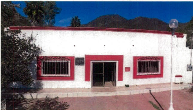
Vista exterior de Centro de Usos Múltiples

Iniciándose con la Rehabilitación de centro de usos múltiples, el consistió rehabilitación del sistema eléctrico, colocación de falso plafón de tablaroca, pisos de concreto, muros divisorios con el sistema muro block, puertas de emergencia y suministro y colocación de mini Split, en la cual se detectaron: Conceptos pagados no ejecutados y Deficiencias técnicas, mismas que se asentaron en acta de sitio.