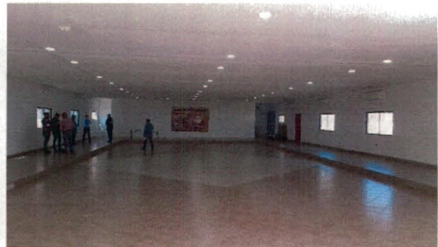
Vista interior de Centro de Usos Múltiples