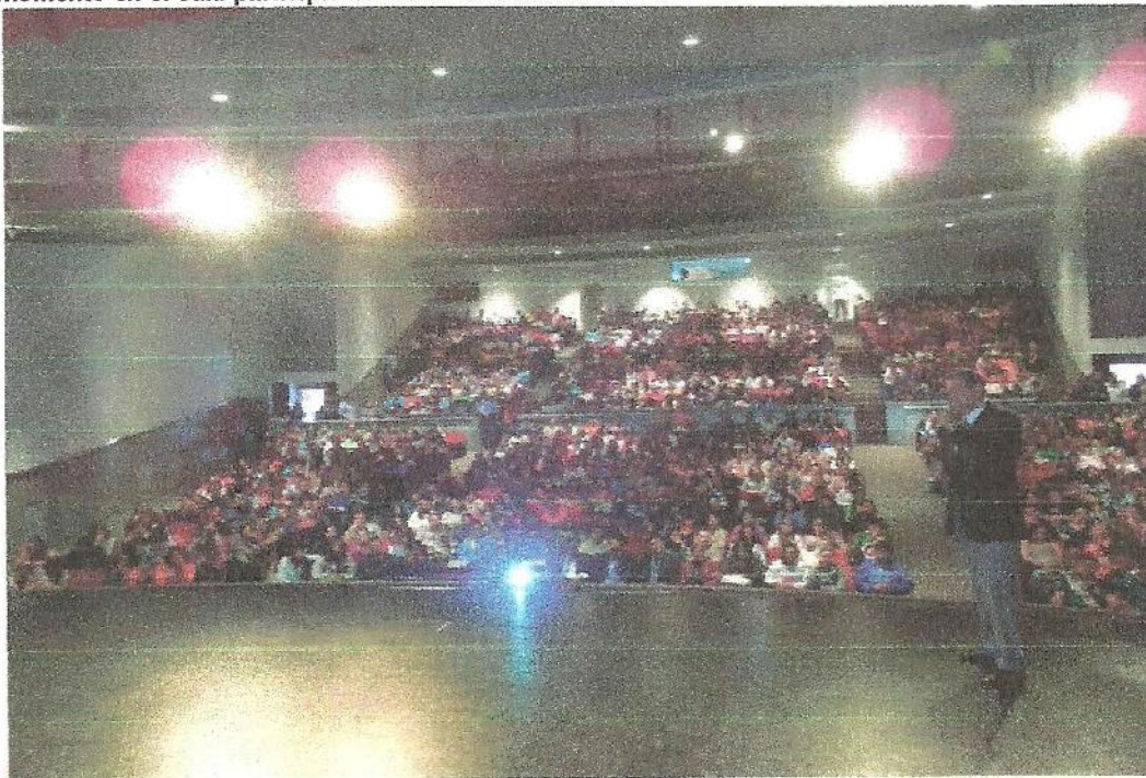
Imagen 3: Reunión con Becarios Renovantes de PRONABES del ITSON en Ciudad Obregón, momento en el cual participa el titular del Instituto.

Este proyecto es impulsado por el Instituto en coordinación con la Secretaría de Desarrollo Social del Gobierno del Estado de Sonora, SEDESON; las actividades a realizar son diversas, tales como la prestación de servicios personales de padrinazgo y tutoría a alumnos de educación básica, de asesoría académica; de promoción deportiva y de colaboración en la difusión del arte, la cultura, y de la salud de los habitantes de un área geográfica determinada, así como la solidaridad con otros habitantes en condiciones de mayor vulnerabilidad o que hacen frente a alguna situación adversa.