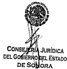
Lic. Claudia Artemiza Pavlovich Arellano Gobernadora Constitucional del Estado de Sonora

CONSEJERÍA JURÍDICA DEL GOBIERNO DEL ESTADO DE SONORA