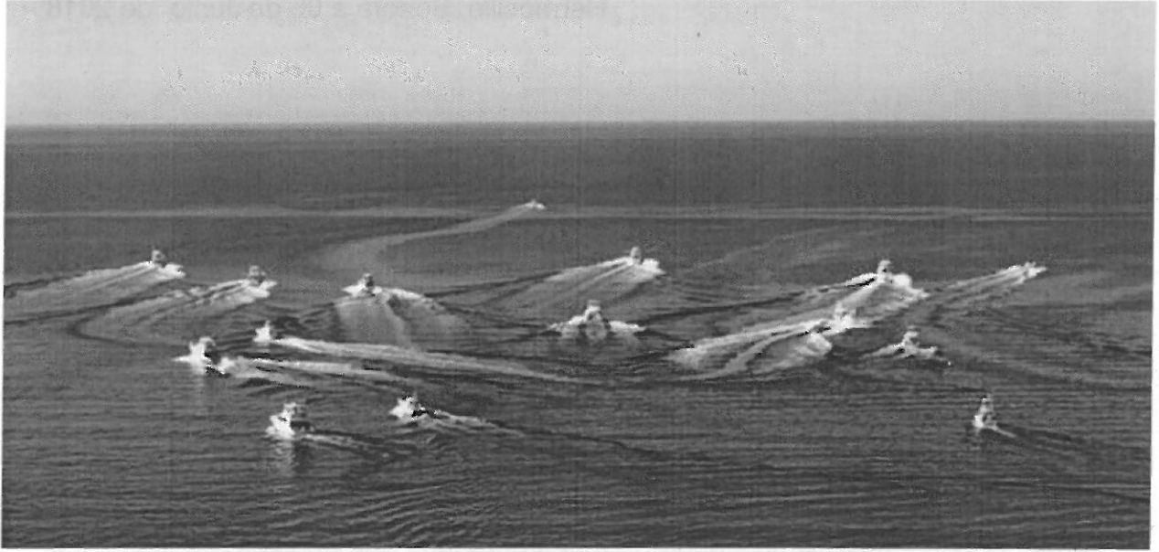
contaran con permiso de Pesca Deportivo Vigés