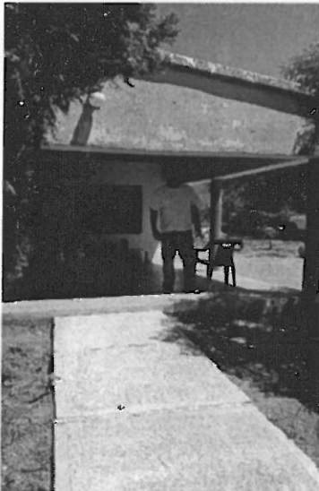
Inspector de Huepari, S. P. de la Cueva

Se realizo entrega de pre llenados de CENSOS GANADEROS 2018, a inspectores de ganadería (15), recabando en algunos casos las quías de transito expedidas y canceladas .