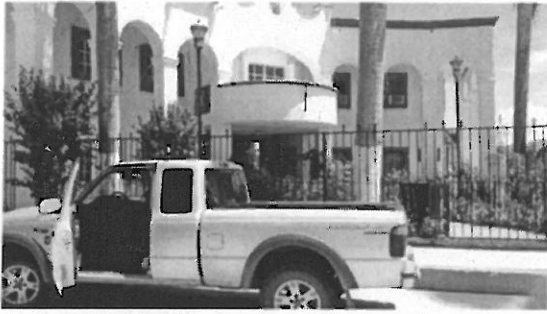
H. Ayuntamiento de Suaqui Grande.

Con los inspectores de la 4ta Zona de Villa Pesqueira y la 7ma Zona del municipio de la Colorada se recabo información (guías de transito expedidas en los años de 2015, 16, 17 y 18) para integrar expediente con no. 1089/2013, relativo a Juicio Ordinario Civil, promovido por integrantes de la Familia Pllat Lucero, ante Juez Primero de Primera Instancia de lo Civil del Distrito Judicial de Hermosillo, Sonora.