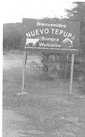
Entrada a la comunidad de Tepupa, S.P.C.

Dando seguimiento a la circular 534, la instrucción para todos los inspectores es de exigir en carácter de obligatorio la VALIDACION de los aretes del SINIIGA, que porta el ganado que se va a movilizar y el existente en el predio, requisito para la expedición de la guía de transito, sin excepción de persona. Así mismo a los acopiadores de ganado en los diferentes municipios se solicita para la expedición de la guía de transito, presenten el P.S.G. registro que se obtiene en ventanilla del SINIIGA, ubicada en Hermosillo.