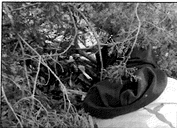
Observadores en la carraca o espiadero

Para realizar el monitoreo, se tenía que estar en los puntos de observación que previamente fueron cebados con maíz, trigo o sorgo días antes de nuestro arribo, por lo menos una hora antes de la salida del sol esperando dentro de las carracas o espiaderos, para poder realizar los registros de los guajolotes que acudían al sitio para alimentarse o que atendían al llamado del reclamo que se realizaba para atraerlos.