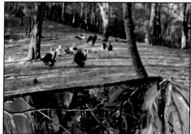
Guajolotes registrados en el cebadero

Es importante mencionar que el monitoreo se realizó a partir del 14 al 20 de abril, durante un periodo de 4 horas aproximadamente, iniciando desde las cinco de la mañana hasta las nueve de la mañana o bien hasta que el último guajolote que estaba en el sitio se retiraba para no ocasionar un disturbio en los ejemplares.