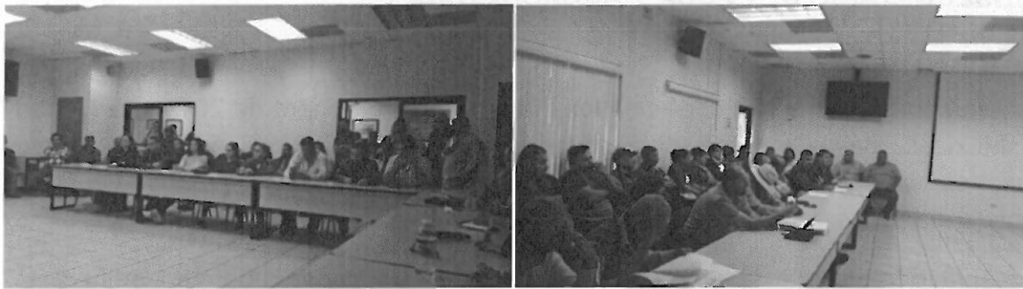
Reunión del día 15